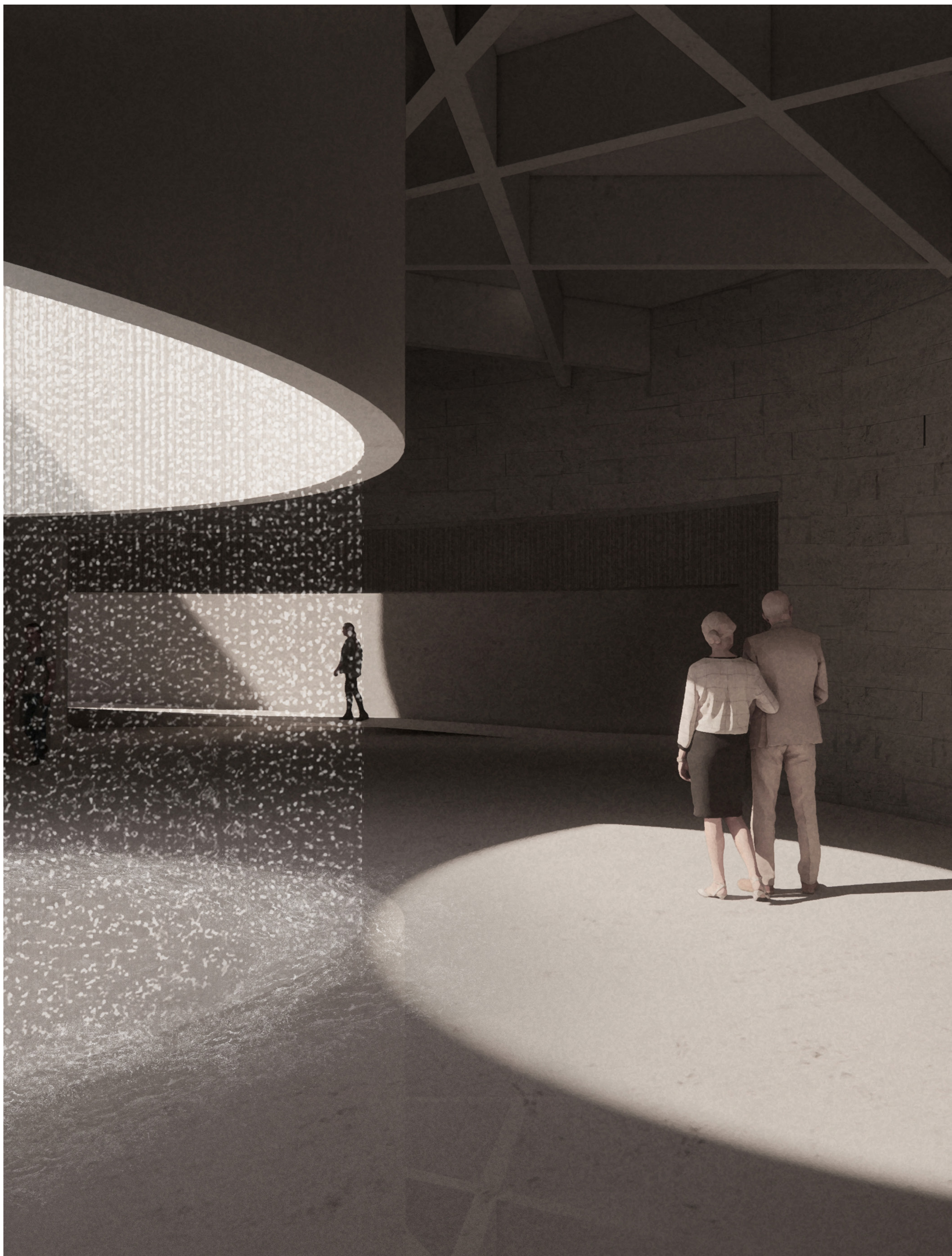
Guider par la lumière , perspective depuis l'espace de recueillement vers la séquence de sortie, mai 9h.