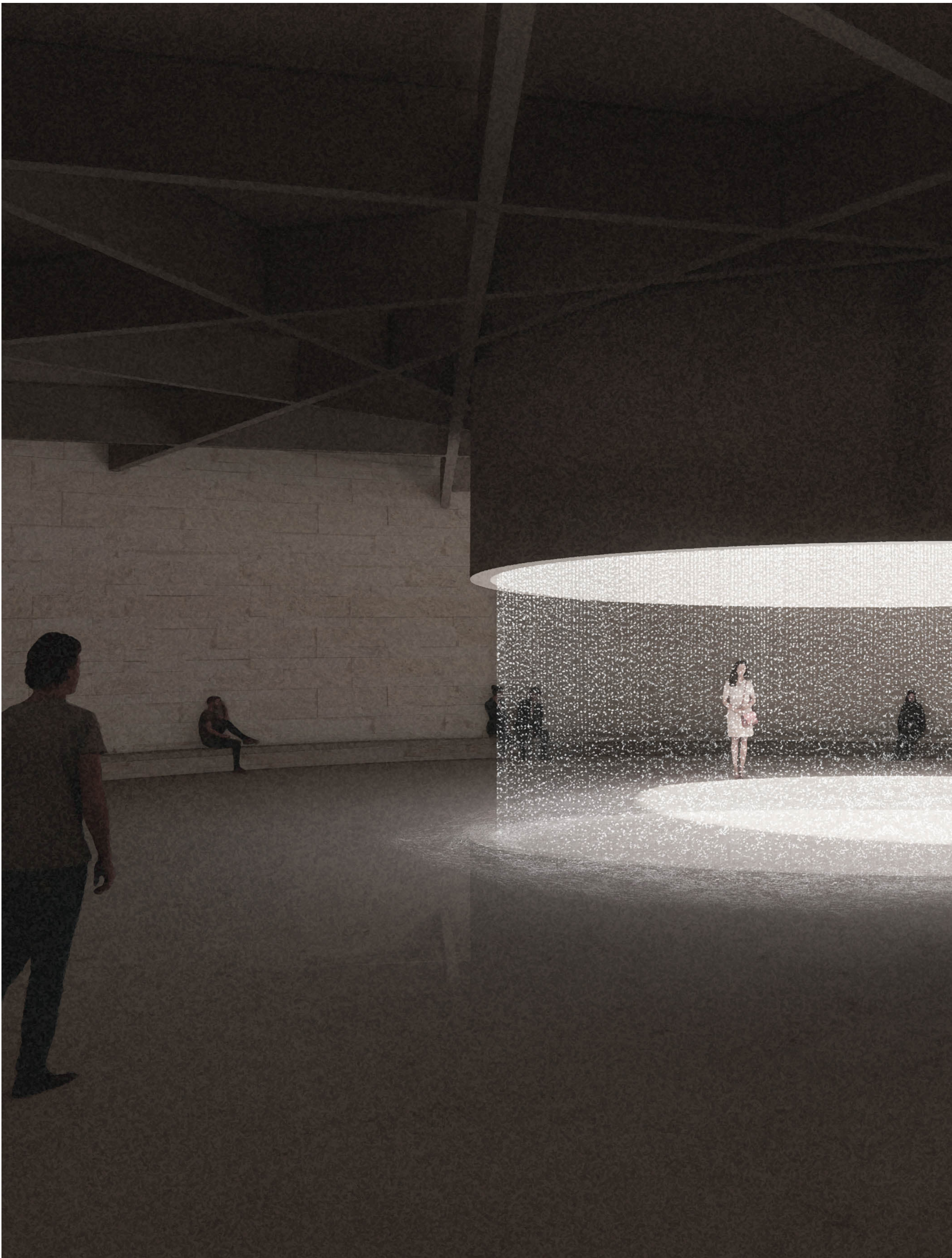
Les larmes de la ville, perspective depuis l'entrée de l'espace de recueillement, solstice d'été 14h.