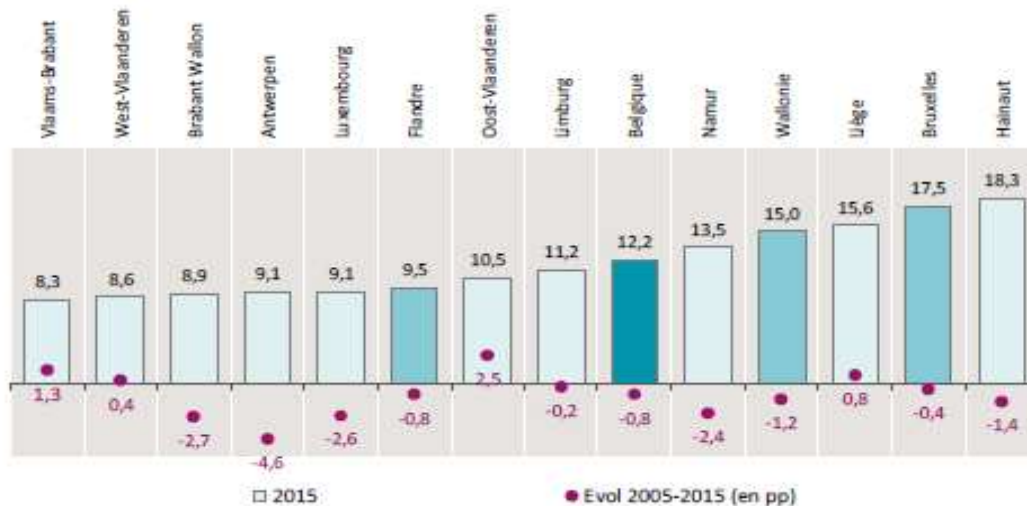
Taux de NEET 2015 et évolution entre 2005 et 2015 selon les régions et provinces de Belgique 2

Le nombre de NEET en Europe était estimé en 2015 à 7,5 millions jeunes de moins de 25 ans. Le taux de NEET au sein de l'Union européenne était estimé en 2015 à 12 %. Cependant, on constate d'importantes variations d'un Etat membre à l'autre : de 5 % à 25 %. Le taux en Belgique varie à son tour suivant les régions de 8,3% à 18,3% comme on peut le constater à la lecture du graphique 2.