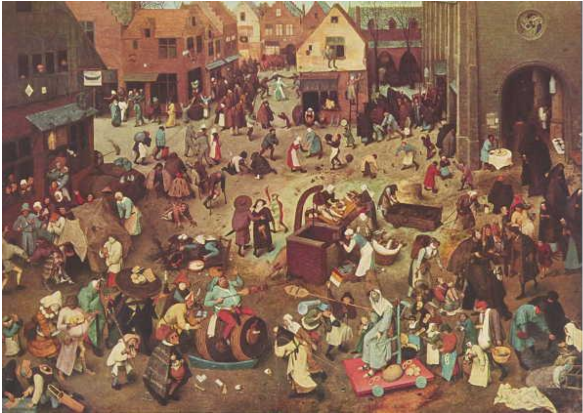
BRUEGEL Pieter, Le combat de Carnaval et Carême , 1559.