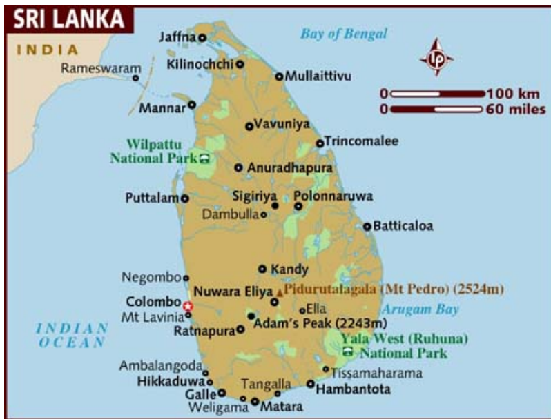
Figure b. Carte du Sri Lanka 2

Le travail de WAPA international et de leur partenaire Centre For Child Development s’articule autour de trois programmes :