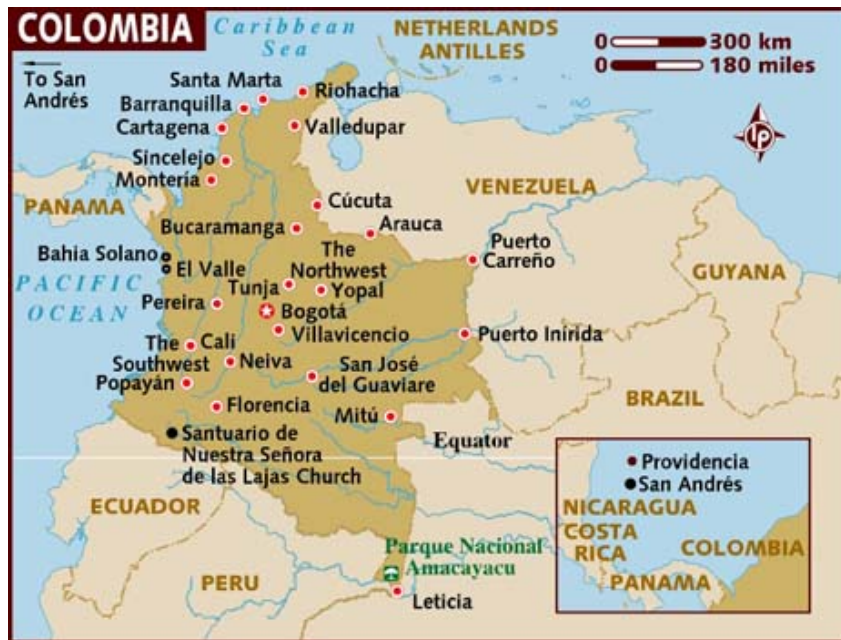
Figure c. Carte de Colombie 3

Après une mission exploratoire, l'association WAPA international a signé un accord de partenariat afin de financer une partie du programme d'art-thérapie mis en place par la Corporacion Proyeactarte. La Corporacion Proyeactarte utilise la création artistique pour permettre aux jeunes d'exprimer leurs histoires de vie.