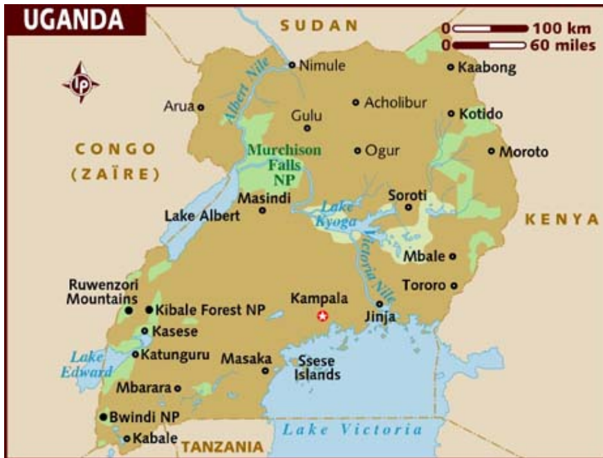
Figure a. Carte d'Ouganda 1

Depuis 2013, l'ASBL travaille en Ouganda avec son partenaire local Karin Community Initiatives Uganda (KCIU). L'association et son partenaire sont actifs dans le Nord du pays, plus précisément dans le district de Gulu.