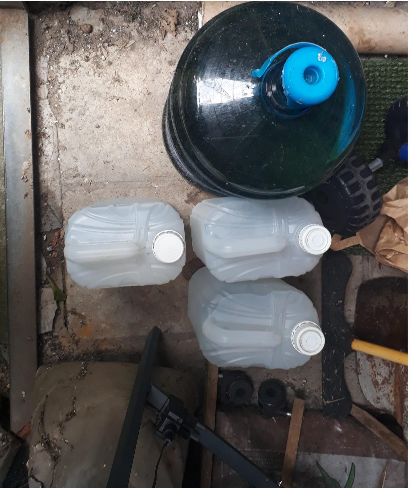
Stockage d'eau 9 °c