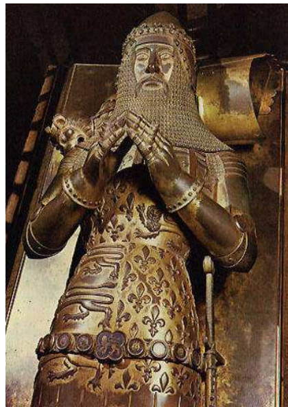
Figure 4 : Gisant d'Edouard de Woodstock, Abbaye de Westminster

fonction 270 . Nous pouvons illustrer cette dernière affirmation par l'exemple du gisant du Prince Noir (Figure 4) : Edouard de Woodstock y est représenté comme un chevalier en prière, « dans la sveltesse qu'il avait perdue depuis fort longtemps » 271 . La coutume des « effigies » aux enterrements royaux est attestée dès 1327 : le but est de représenter le corps politique du roi, d'habitude invisible, sur le cercueil, alors que le corps mortel, d'habitude visible, est enfermé dans le cercueil 272 . Bien qu'il s'agisse, dans ce cas précis, du cercueil d'un prince, la volonté de représenter son corps politique, « immortel », est probablement présente.