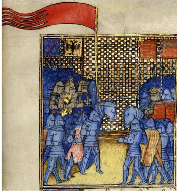
Figure 5 : Froissart, Chroniques , XIV e siècle. Toulouse, BM, Ms. 511, f o 104.

Cette image (Figure 5) représente l'armée française avec Jean de Bohême (à gauche, en doré), en armure, face aux Anglais. Rien ne permet de se rendre compte que ce roi est aveugle 273 . Il est bien sûr difficile de représenter quelqu'un comme étant aveugle, surtout si ce personnage porte un heaume. Cependant, le roi de Bohême est plutôt à son avantage dans cette enluminure : il porte en effet une couronne fermée impériale et une cote armoriée 274 : ici, c'est le prestige des Français et de leurs alliés qui est mis en avant, la cécité de Jean de Bohême n'est qu'un « détail » sans importance.