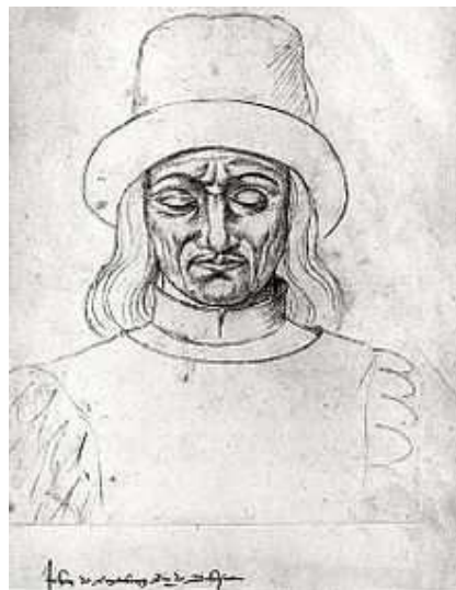
Figure 7 : Jean de Luxembourg et de Bohême dit Jean l'Aveugle. JACQUES LE BOUCQ, Recueil d'Arras , XVI e siècle. Arras, Bibliothèque municipale, Département des Manuscrits, Ms. 266, f o 171.

Un autre exemple de ce type d'image est le portrait de Jean l'Aveugle réalisé par Jacques Le Boucq dans son Recueil d'Arras (Figure 7). Celle image a en effet de quoi nous intriguer.