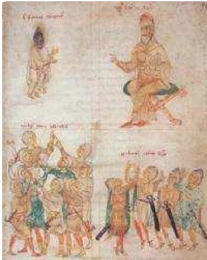
Figure 1 : Le peuple (à gauche) et les chevaliers (à droite) soutiennent respectivement Tancrede et le comte Roger d'Andria. Liber ad Honorem Augusti , Berne, Bibliothèque municipale, Ms. 120, f°99r.

changer sa représentation « normale » de trois-quarts par une représentation de profile, moins sympathique, voire pour barbouiller son visage d'encre 257 , comme c'est le cas pour la figure 1. Il est clair que le Liber ad Honorem Augusti souhaite véhiculer une image négative de ce souverain de Sicile, et il joue pour cela, dans les illustrations du moins, sur l'invalidité de celui-ci.