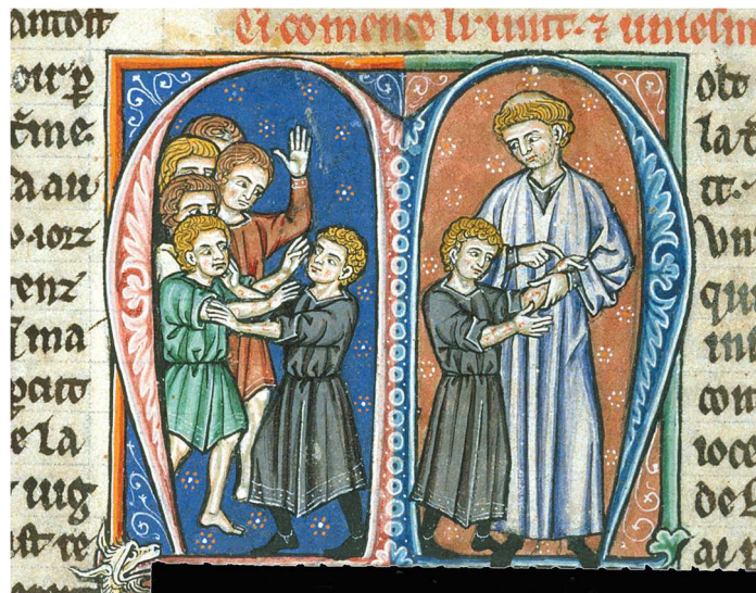
Figure 3 : A gauche : Baudouin IV avec d'autres jeunes garçons ; à droite : Guillaume de Tyr reconnaissant les symptômes de la lèpre chez le jeune Baudouin IV. Histoire générale des Croisades , entre 1250 et 1259. Londres, British Library, Yates Thompson 12, f°152v.

Sur cette image (Figure 3), le jeune Baudouin IV est représenté couvert d'écorchures, qu'il se fait en se battant avec d'autres enfants ; la miniature de droite représente Guillaume de Tyr, constatant que Baudouin ne ressent aucune douleur dans les bras malgré les blessures, ce qui l'amène à la conclusion que le jeune prince est atteint de la lèpre 269 . L'image n'est pas réductrice, elle nous indique simplement comment la maladie du prince est constatée, alors qu'il est encore enfant.