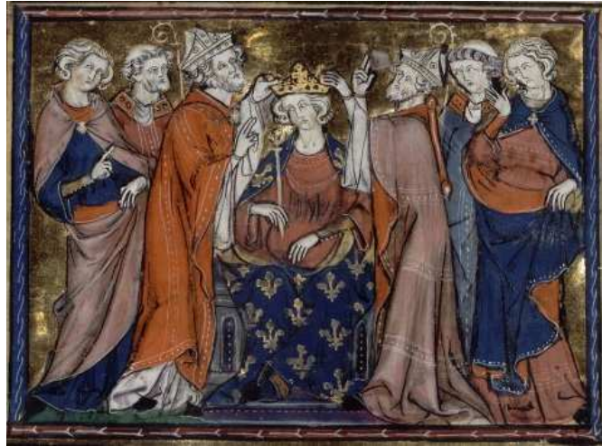
Figure 6 : Couronnement de Louis VI le Gros. Grandes Chroniques de France , premier quart du XIV e siècle. Paris, Bibliothèque nationale de France, Département des Manuscrits, Division occidentale, Français 2615, f o 161.

Un autre exemple de ce type d'image est le portrait de Jean l'Aveugle réalisé par Jacques Le Boucq dans son Recueil d'Arras (Figure 7). Celle image a en effet de quoi nous intriguer.