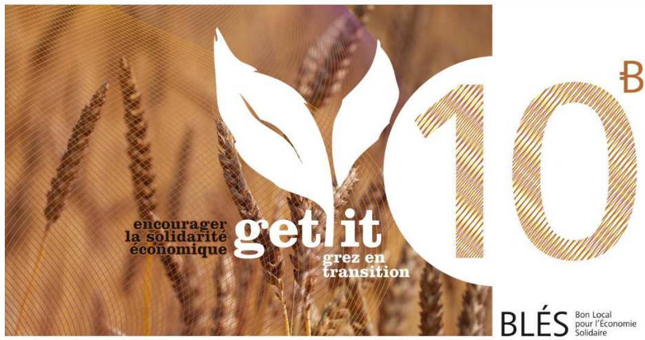
Figure 1 Billet de 10 Blés