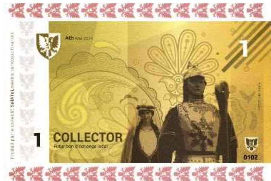
Figure 4 Billet collector d'un SolAtoi