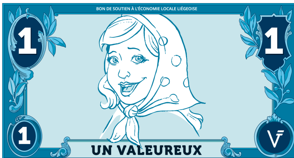
Figure 3 Billet d'un Valeureux