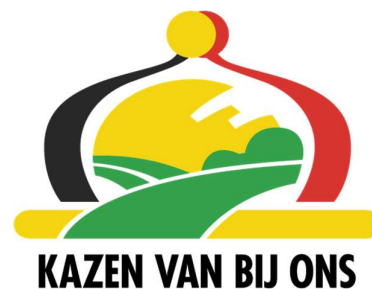
Figure 4: Logos "Fromages de chez nous/Kazen van bij ons"

Ces logos font partie d'une campagne lancée par le VLAM, Vlaams Centrum voor Agro- en Visserijmarketing , une agence autonome externe de la région flamande (Vlaamse overheid, 2021). Cette campagne, débutée en 2010 (Nieuwsblad, 2010), vise à promouvoir les fromages belges et leur utilisation. Outre le logo, la campagne se compose de spots TV faisant la publicité du fromage (visible notamment sur Youtube), et d'un site web reprenant l'ensemble des fromages portant le logo, des recettes de cuisine et de nombreuses autres informations sur les fromages (VLAM, 2021).