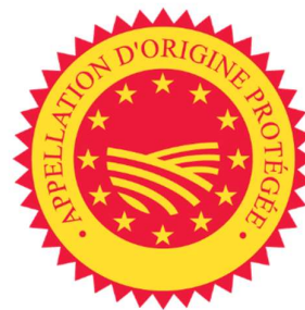
Figure 2: Logo "Appellation d'origine protégée"

L'appellation d'origine protégée est une indication géographique européenne établissant un droit de propriété intellectuelle pour des produits liés à un lieu de production et respectant un cahier des charges précis. Cette appellation et le logo associé, représenté en Fig.2, ont été introduits par le règlement de l'Union Européenne n°2081/92, en 1992 (Parlement Européen et Conseil, 1992).