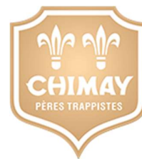
Figure 11: Logo "Chimay"

Chimay Fromages produit les fromages de la marque Chimay (logo en Fig.11). Elle est détenue par la fondation d'intérêt public Chimay-Wartoise FUP (Fondation Chimay Wartoise, 2021), fondée par la communauté des moines cisterciens de l'Abbaye de Scourmont, également actionnaire principal de l'ensemble des entités du groupe Chimay.