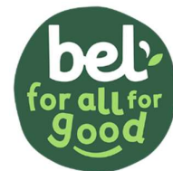
Figure 8: Logo "Bel"

Bel Belgium est une filiale du groupe français Bel (logo en Fig.8). Elle détient de nombreuses marques ( Babybel , Vache qui rit , Leerdammer , etc.), dont la marque Maredsous , seule à être retenue dans cette étude comme faisant référence à la Belgique, du fait du lieu auquel cette marque fait référence