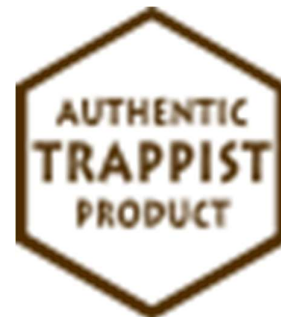
Figure 3: Logo "Authentic Trappist Product"

Ce logo est attribué par l'association internationale trappiste (Association Internationale Trappiste, 2021), réunissant 21 abbayes de moines trappistes.