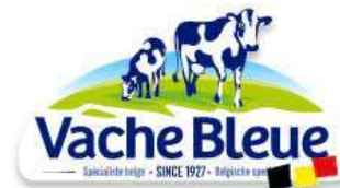
Figure 10: Logo "Vache Bleue"

Vache Bleue (logo en Fig.10) produit les fromages de la marque éponyme.