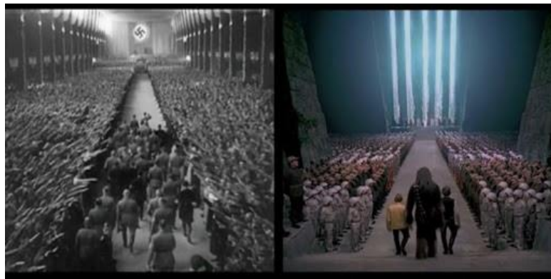
Le Triomphe de la volonté (1933)

Deux ans avant la nuit des longs couteaux, Leni Riefenstahl assistait à son premier meeting politique. C'était en février 1932 au Sportpalast de Berlin et celle qui fut tour à tour danseuse, actrice, réalisatrice et photographe fut littéralement bouleversée par le discours d'Aldolf Hitler. Après un échange de courriers, ils devinrent amis. Il la sollicite en 1935 afin de réaliser Le Triomphe de la volonté , film de propagande mettant en exergue l'ordre, l'esthétique et le perfectionnisme formels, les corps en mouvement et bien sûr, le dictateur lui-même.