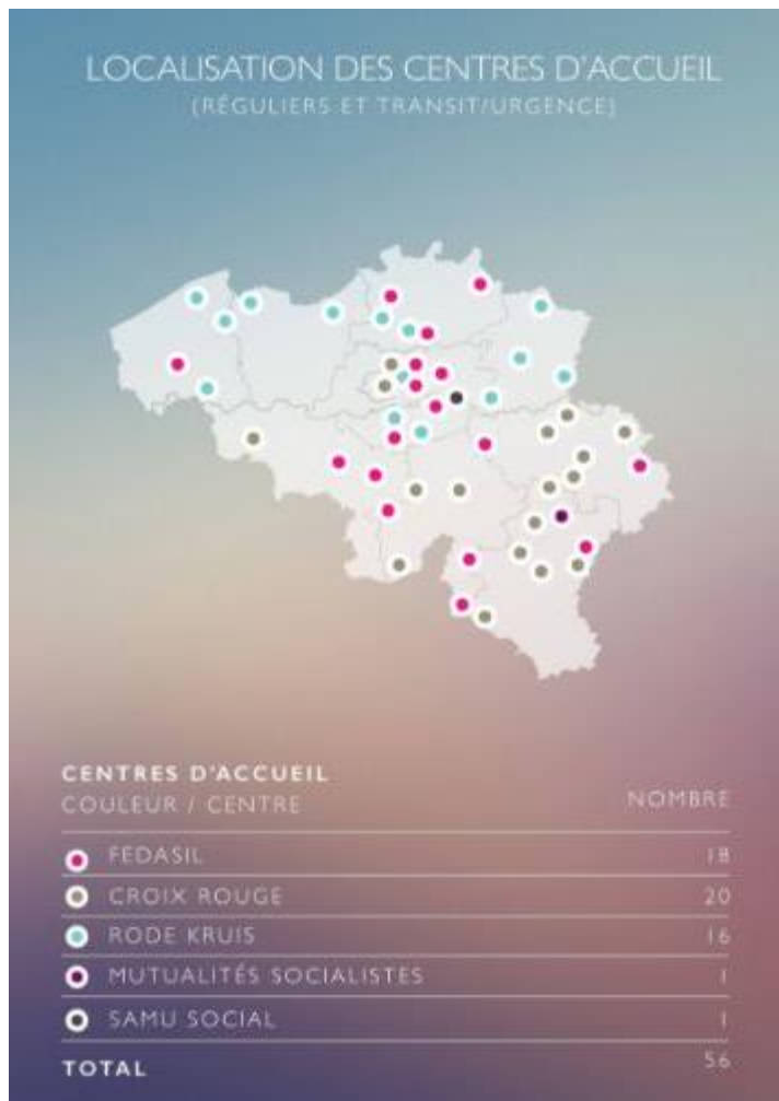
Figure 2 Répartition des centres d'accueil en Belgique, 2015 3

La Croix-Rouge de Belgique, avec ce chiffre, apparaît comme l'un des partenaires principaux de FEDASIL. Il faut aussi noter que, depuis 2008, cette organisation a mis en place un plan d'accueil d'urgence pour résorber dans une certaine mesure le flux constaté sur le front de l'immigration en Belgique. C'est dans cette même visée qu'elle a ouvert trois centres à Bierset, Bastogne et Gembloux, qui étaient des anciennes casernes (CROIX-ROUGE, 2017). En 2015 (CROIX-ROUGE, 2015), la crise de l'accueil pousse la Croix-Rouge à agrandir ses capacités d'accueil, portant celles-ci à un total de 9300 places. Ainsi, en 6 mois, 6000 places ont été créées.