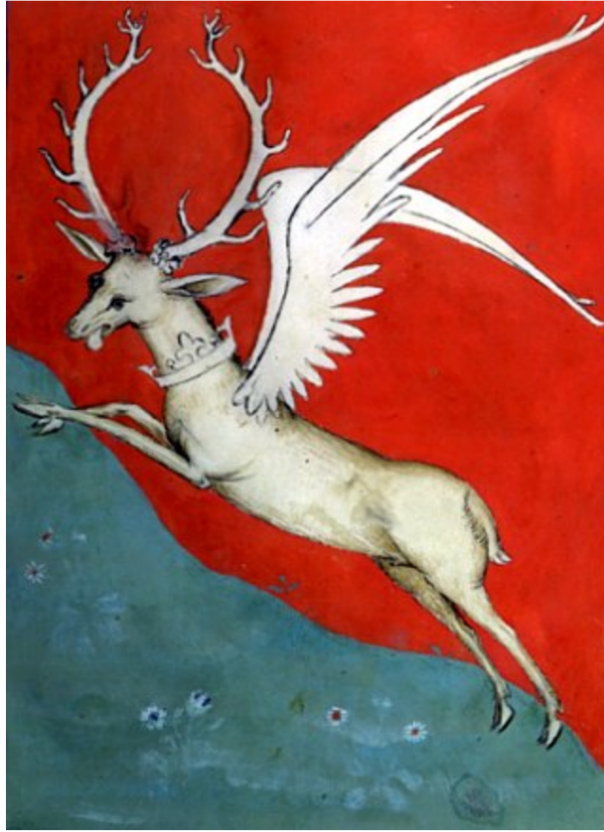
Fig. 1. Maître inconnu, Devise de Charles VI , 1390. Miniature polychromée, dimensions inconnues, Paris, Bibliothèque nationale de France, BNF Arsenal ms. 2682, folio 34.