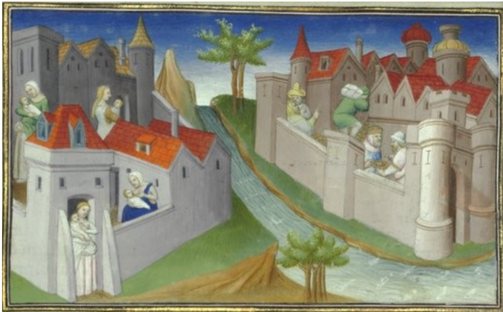
Fig. 78. Maître de la Mazarine et ses collaborateurs, Organisation de deux îles respectivement peuplées de femmes et d'hommes , 1410-1412. Miniature polychromée, 81/112 x 160/162 mm, Paris, Bibliothèque nationale de France, BNF ms. fr. 2810, folio 87r.