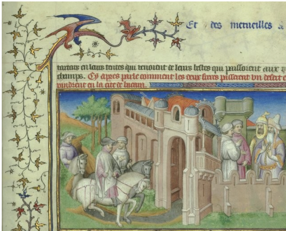
Fig. 2. Maître de la Mazarine et ses collaborateurs, Arrivée des frères Niccolò et Matteo Polo , 1410-1412. Miniature polychromée, 81/112 x 160/162 mm, Paris, Bibliothèque nationale de France, BNF ms. fr. 2810, folio 2r.