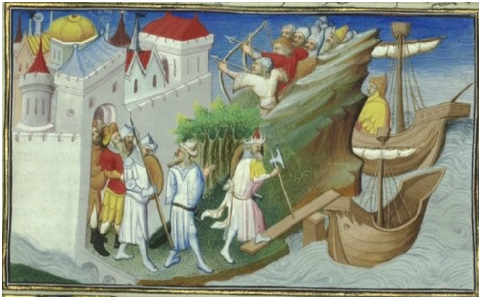
Fig. 67. Maître d'Egerton et Maître de la tendance de Bedford avec leurs collaborateurs, Pillage de la cité ennemie par les hommes du Khan , 1410-1412. Miniature polychromée, 81/112 x 160/162 mm, Paris, Bibliothèque nationale de France, BNF ms. fr. 2810, folio 72r.