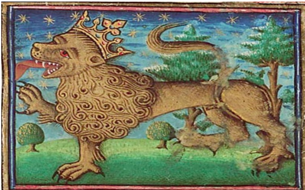
Fig. 6. Maître inconnu, Le roi des animaux sauvages , vers 1450. Miniature polychromée, dimensions inconnues, La Haye, Museum Meermanno Westreenianum, MS. 10B 25, folio 1.