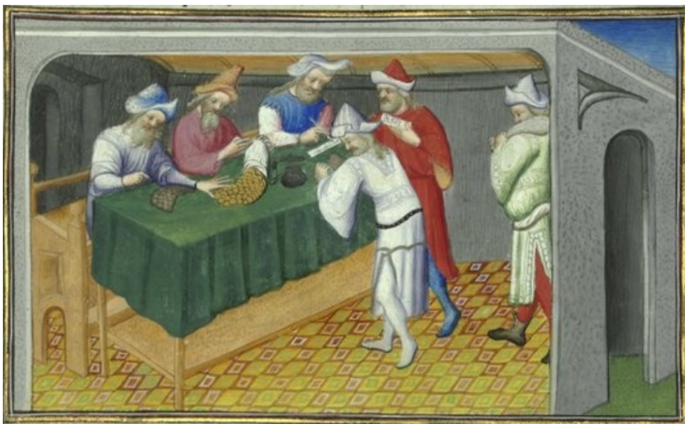
Fig. 65. Maître d'Egerton et Maître de la tendance de Bedford avec leurs collaborateurs, Gestion et organisation de la cité de Quinlay , 1410-1412. Miniature polychromée, 81/112 x 160/162 mm, Paris, Bibliothèque nationale de France, BNF ms. fr. 2810, folio 69r.