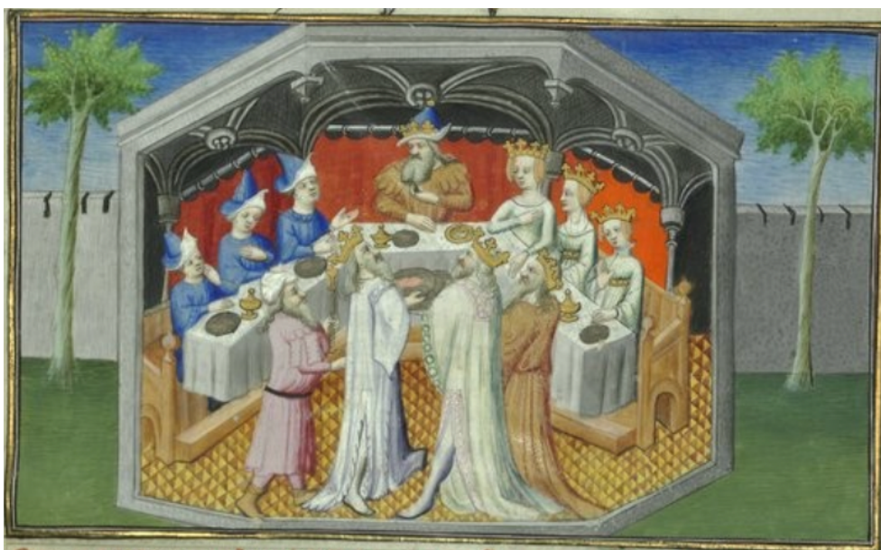
Fig. 43. Maître d'Egerton et Maître de la tendance de Bedford avec leurs collaborateurs, Cour du Khan , 1410-1412. Miniature polychromée, 81/112 x 160/162 mm, Paris, Bibliothèque nationale de France, BNF ms. fr. 2810, folio 39r.