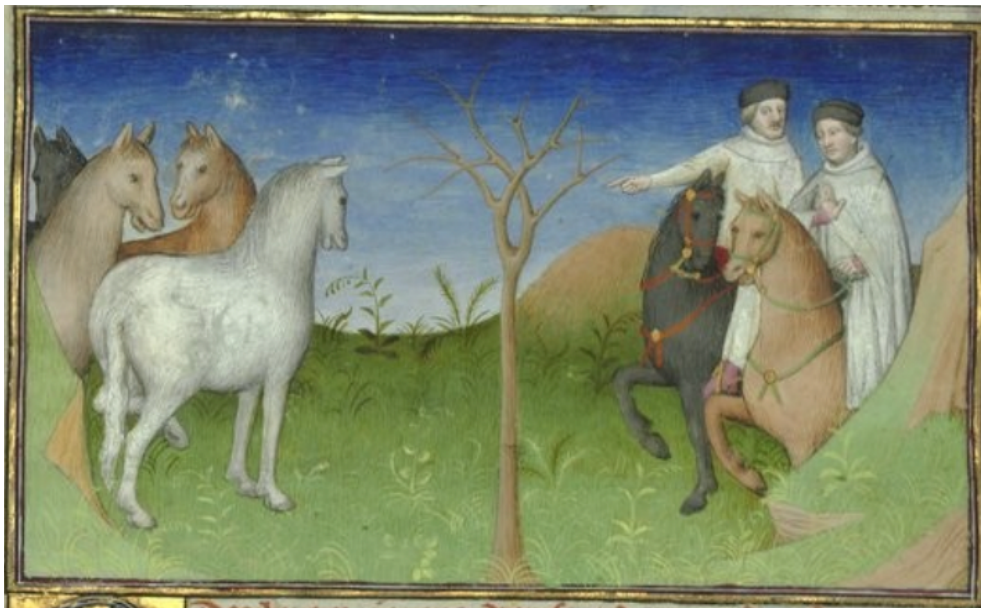
Fig. 17. Maître de la Mazarine et ses collaborateurs, Le royaume de Chalam , 1410-1412. Miniature polychromée, 81/112 x 160/162 mm, Paris, Bibliothèque nationale de France, BNF ms. fr. 2810, folio 12v.