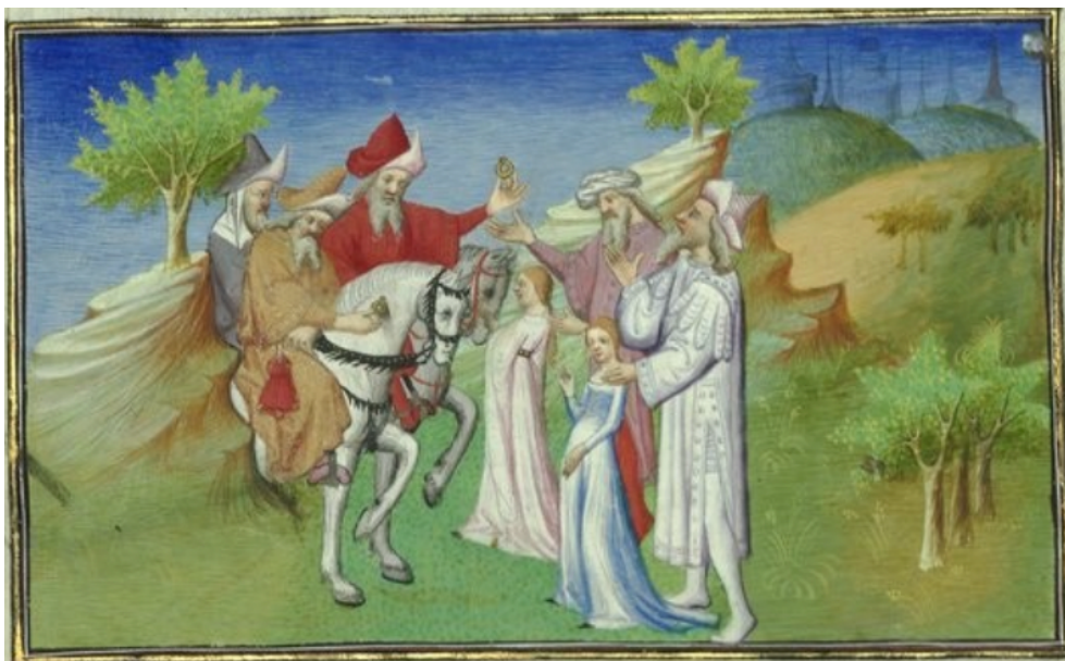
Fig. 55. Maître d'Egerton et Maître de la tendance de Bedford avec leurs collaborateurs, Coutume du mariage de la province de Tebet , 1410-1412. Miniature polychromée, 81/112 x 160/162 mm, Paris, Bibliothèque nationale de France, BNF ms. fr. 2810, folio 52v.