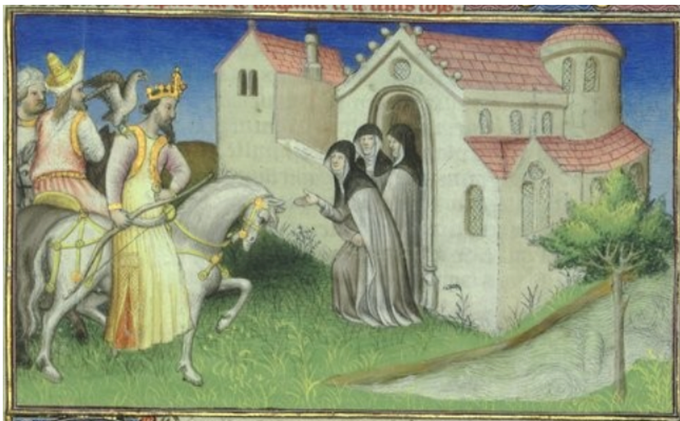
Fig. 11. Maître de la Mazarine et ses collaborateurs, Le bon roi du tartare , 1410-1412. Miniature polychromée, 81/112 x 160/162 mm, Paris, Bibliothèque nationale de France, BNF ms. fr. 2810, folio 8r.