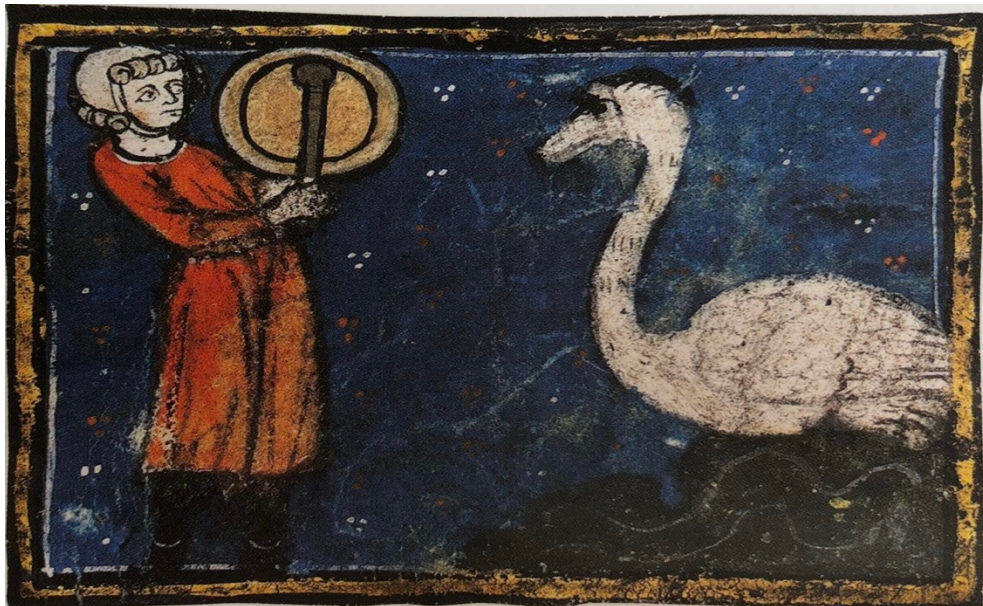
Fig. 2. Maître inconnu, Un cygne accompagnant un Hyperboréen , 1235. Miniature polychromée, 334 x 235 mm, Paris, Bibliothèque nationale de France, BNF ms. fr. 412, folio 229.