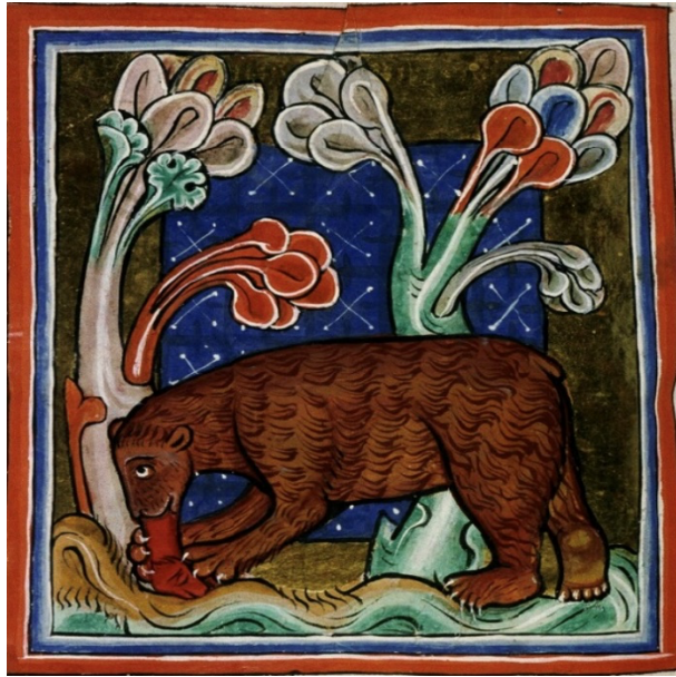
Fig. 5. Maître inconnu, L'ourse modelant son ourson , vers 1230-1240. Miniature polychromée, 298 x 195 mm, Oxford, Bodleian Library, MS. Bodley 764, folio 22v.