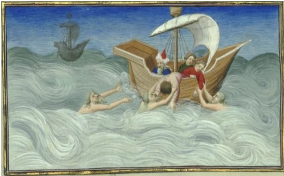
Fig. 68. Maître d'Egerton et Maître de la tendance de Bedford avec leurs collaborateurs, Île de Janna , 1410-1412. Miniature polychromée, 81/112 x 160/162 mm, Paris, Bibliothèque nationale de France, BNF ms. fr. 2810, folio 73v.