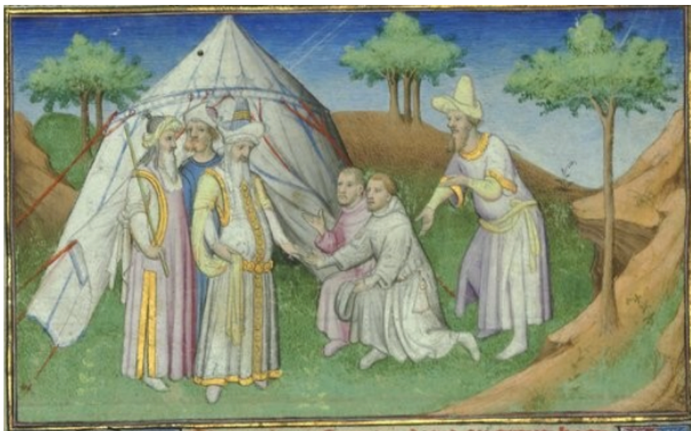
Fig. 3. Maître de la Mazarine et ses collaborateurs, Présentation des frères Niccolò et Matteo Polo au Khan , 1410-1412. Miniature polychromée, 81/112 x 160/162 mm, Paris, Bibliothèque nationale de France, BNF ms. fr. 2810, folio 2v.