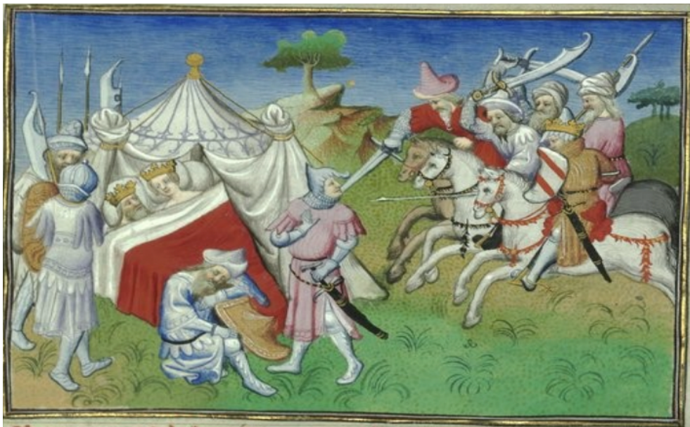
Fig. 39. Maître d'Egerton et Maître de la tendance de Bedford avec leurs collaborateurs, Début de la bataille entre Khan et Nayan dit le traître , 1410-1412. Miniature polychromée, 81/112 x 160/162 mm, Paris, Bibliothèque nationale de France, BNF ms. fr. 2810, folio 34r.