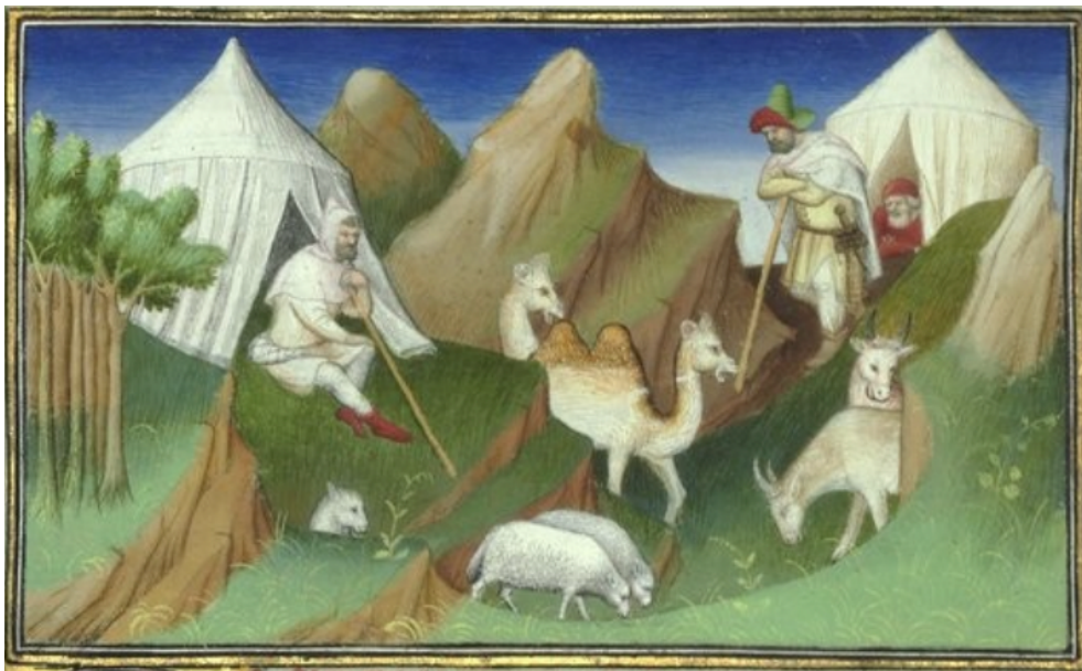
Fig. 27. Maître de la Mazarine et ses collaborateurs, Province de Sartiam , 1410-1412. Miniature polychromée, 81/112 x 160/162 mm, Paris, Bibliothèque nationale de France, BNF ms. fr. 2810, folio 21v.