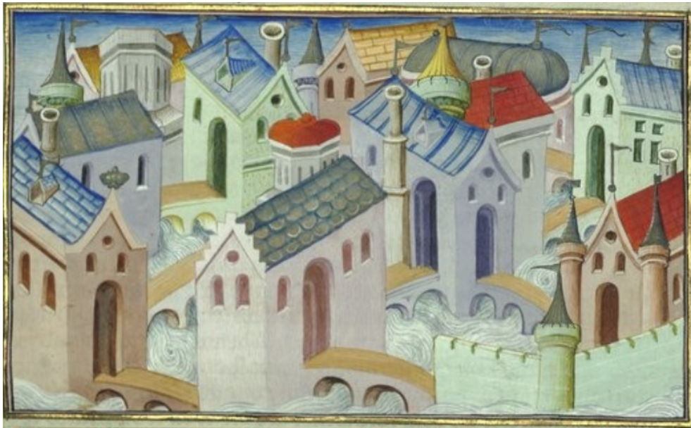
Fig. 64. Maître d'Egerton et Maître de la tendance de Bedford avec leurs collaborateurs, Cité de Quinlay capitale de la contrée de Mangy , 1410-1412. Miniature polychromée, 81/112 x 160/162 mm, Paris, Bibliothèque nationale de France, BNF ms. fr. 2810, folio 67r.