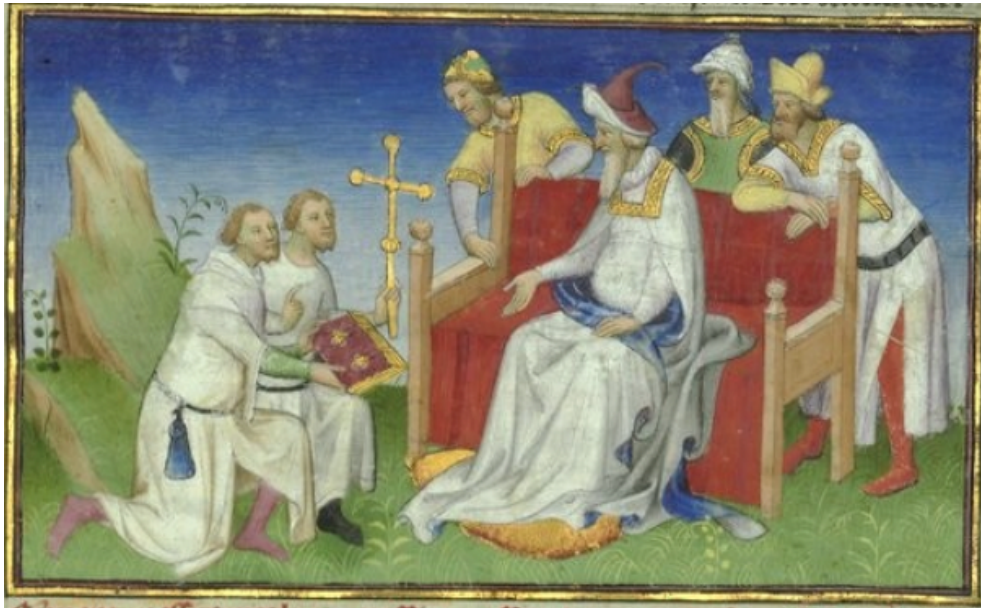
Fig. 8. Maître de la Mazarine et ses collaborateurs, Présentation des reliques saintes et de la religion occidentale , 1410-1412. Miniature polychromée, 81/112 x 160/162 mm, Paris, Bibliothèque nationale de France, BNF ms. fr. 2810, folio 5r.