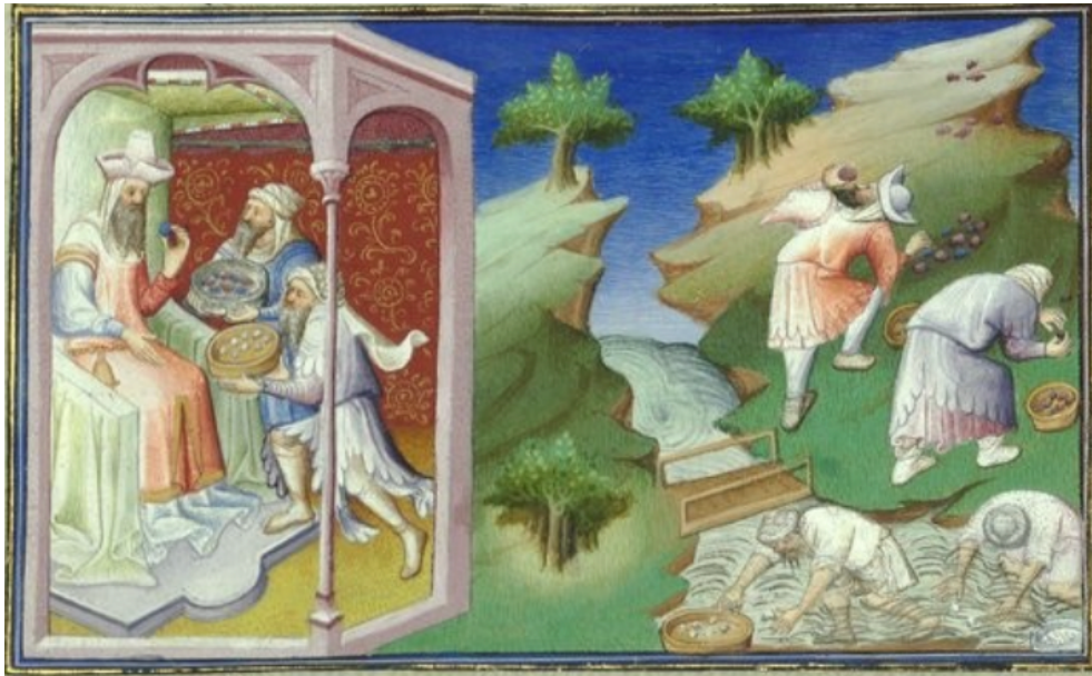
Fig. 56. Maître d'Egerton et Maître de la tendance de Bedford avec leurs collaborateurs, Pêche dans la province de Gamdu , 1410-1412. Miniature polychromée, 81/112 x 160/162 mm, Paris, Bibliothèque nationale de France, BNF ms. fr. 2810, folio 54r.