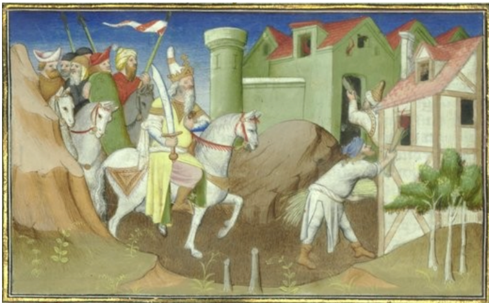
Fig. 83. Maître de la Mazarine et ses collaborateurs, Bataille du roi Caidu contre le Khan , 1410-1412. Miniature polychromée, 81/112 x 160/162 mm, Paris, Bibliothèque nationale de France, BNF ms. fr. 2810, folio 93v.