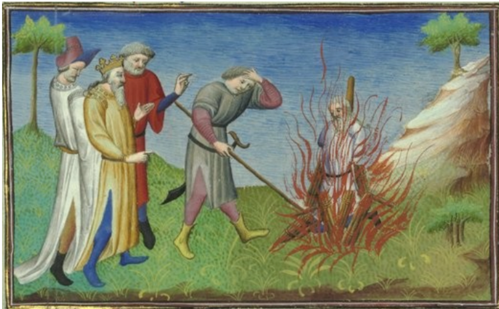
Fig. 30. Maître d'Egerton et Maître de la tendance de Bedford avec leurs collaborateurs, Pratique de la province de Dingnytalas , 1410-1412. Miniature polychromée, 81/112 x 160/162 mm, Paris, Bibliothèque nationale de France, BNF ms. fr. 2810, folio 24r.