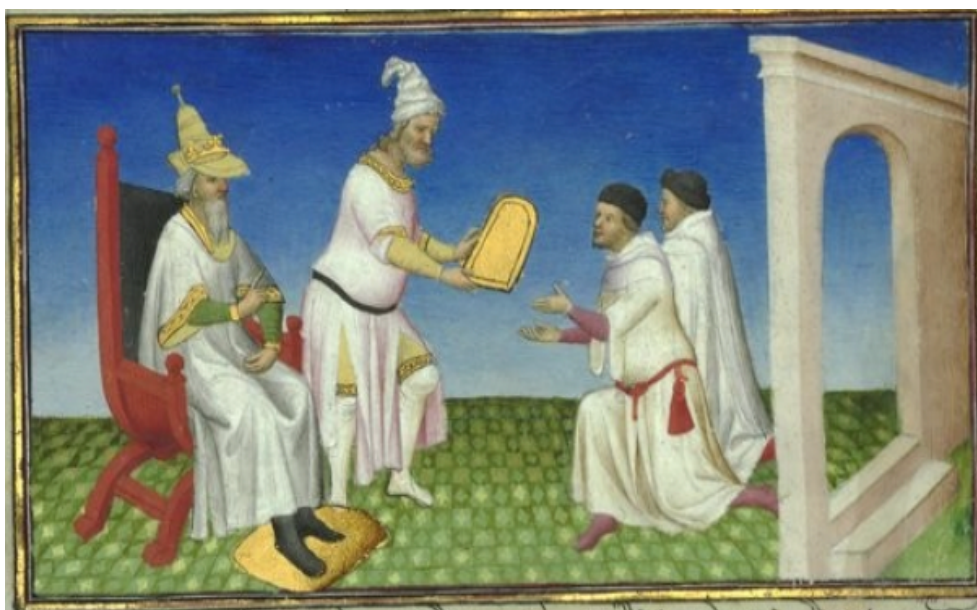
Fig. 5. Maître de la Mazarine et ses collaborateurs, Remise de la tablette d'or , 1410-1412. Miniature polychromée, 81/112 x 160/162 mm, Paris, Bibliothèque nationale de France, BNF ms. fr. 2810, folio 3v.