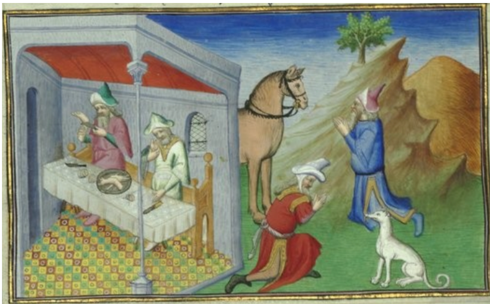
Fig. 69. Maître d'Egerton et Maître de la tendance de Bedford avec leurs collaborateurs, Île de Janna , 1410-1412. Miniature polychromée, 81/112 x 160/162 mm, Paris, Bibliothèque nationale de France, BNF ms. fr. 2810, folio 74v.