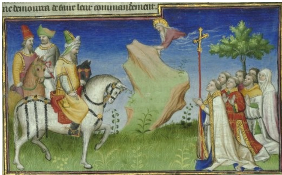
Fig. 14. Maître de la Mazarine et ses collaborateurs, Miracle fait pour l'amour des chrétiens et comment la montagne le remua au nom de Dieu , 1410-1412. Miniature polychromée, 81/112 x 160/162 mm, Paris, Bibliothèque nationale de France, BNF ms. fr. 2810, folio 10v.