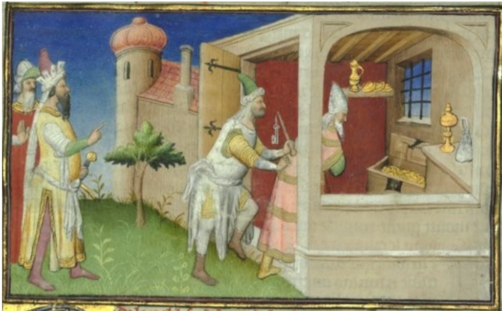
Fig. 12. Maître de la Mazarine et ses collaborateurs, Le siège du calife des Sarazins , 1410-1412. Miniature polychromée, 81/112 x 160/162 mm, Paris, Bibliothèque nationale de France, BNF ms. fr. 2810, folio 9r.