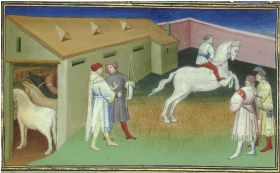
Fig. 82. Maître de la Mazarine et ses collaborateurs (attribution incertaine), Golf de Calatu , 1410-1412. Miniature polychromée, 81/112 x 160/162 mm, Paris, Bibliothèque nationale de France, BNF ms. fr. 2810, folio 92r.