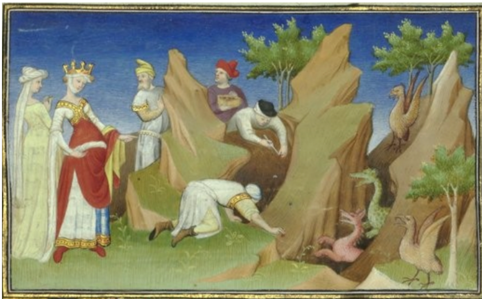
Fig. 73. Maître de la Mazarine et ses collaborateurs, Royaume de Mutfi , 1410-1412. Miniature polychromée, 81/112 x 160/162 mm, Paris, Bibliothèque nationale de France, BNF ms. fr. 2810, folio 81-82r.