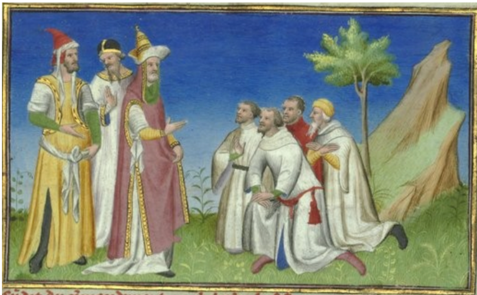
Fig. 13. Maître de la Mazarine et ses collaborateurs, Le commandement du calife aux chrétiens , 1410-1412. Miniature polychromée, 81/112 x 160/162 mm, Paris, Bibliothèque nationale de France, BNF ms. fr. 2810, folio 10r.