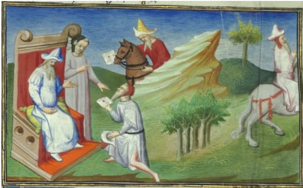
Fig. 50. Maître d'Egerton et Maître de la tendance de Bedford avec leurs collaborateurs, Départ des messagers du Khan vers d'autres provinces , 1410-1412. Miniature polychromée, 81/112 x 160/162 mm, Paris, Bibliothèque nationale de France, BNF ms. fr. 2810, folio 46v.