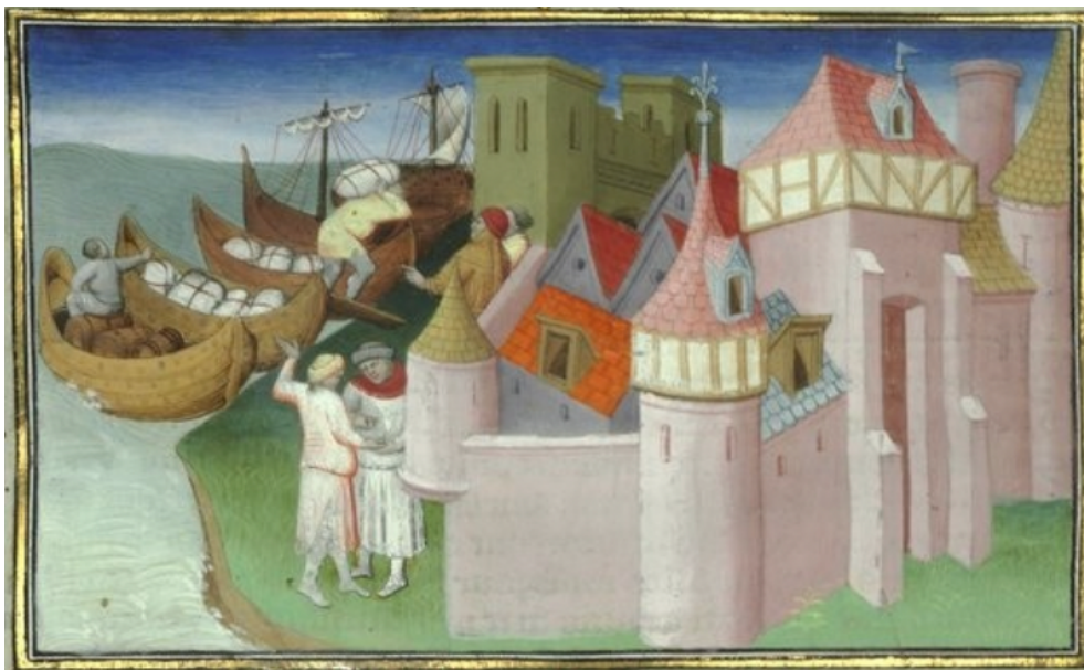
Fig. 77. Maître de la Mazarine et ses collaborateurs, Royaume de Camlaet , 1410-1412. Miniature polychromée, 81/112 x 160/162 mm, Paris, Bibliothèque nationale de France, BNF ms. fr. 2810, folio 86v.