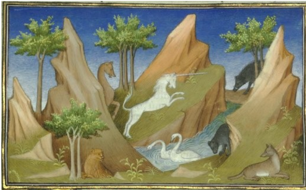
Fig. 76. Maître de la Mazarine et ses collaborateurs, Royaume de Cty , 1410-1412. Miniature polychromée, 81/112 x 160/162 mm, Paris, Bibliothèque nationale de France, BNF ms. fr. 2810, folio 85r.