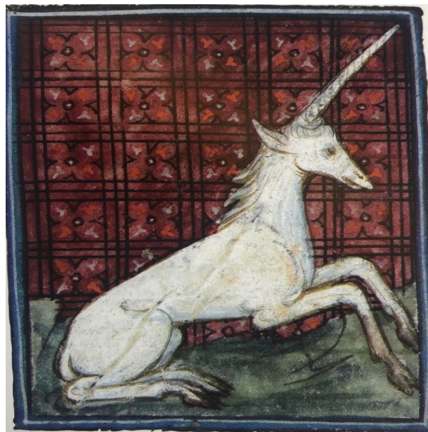
Fig. 10. Maître inconnu, Frontispice sur les bêtes sauvages . Détail de la licorne, XV e siècle. Miniature polychromée, 420 x 307 mm, Chantilly, Musée Condé, ms. 339, folio 271.