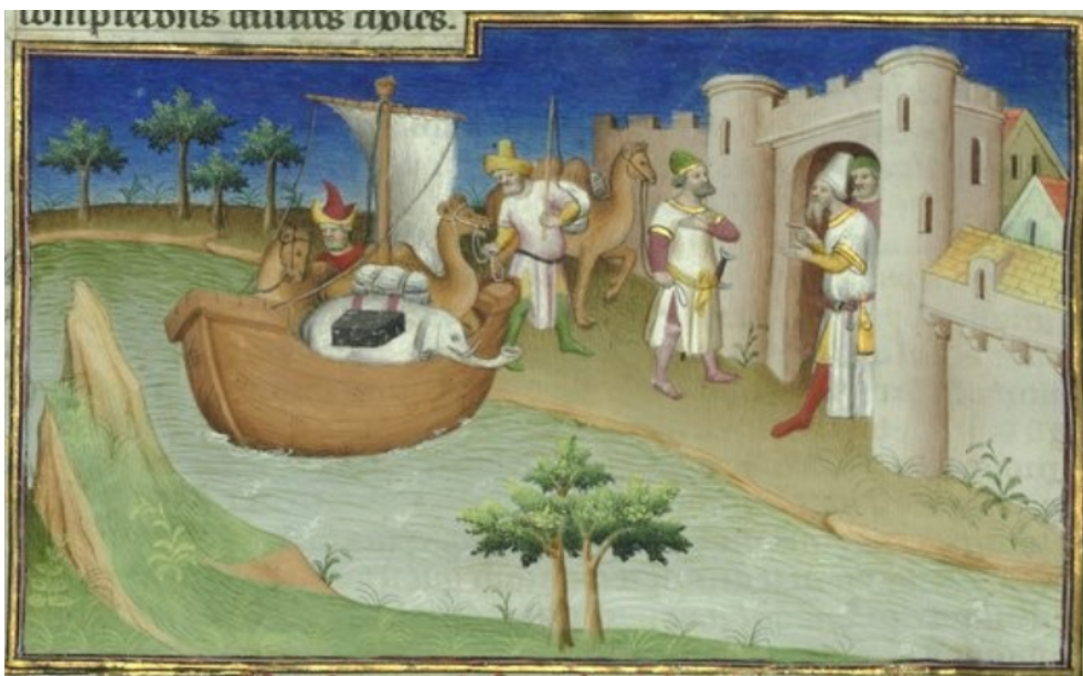
Fig. 19. Maître de la Mazarine et ses collaborateurs, La vallée Toubteufe , 1410-1412. Miniature polychromée, 81/112 x 160/162 mm, Paris, Bibliothèque nationale de France, BNF ms. fr. 2810, folio 14v.