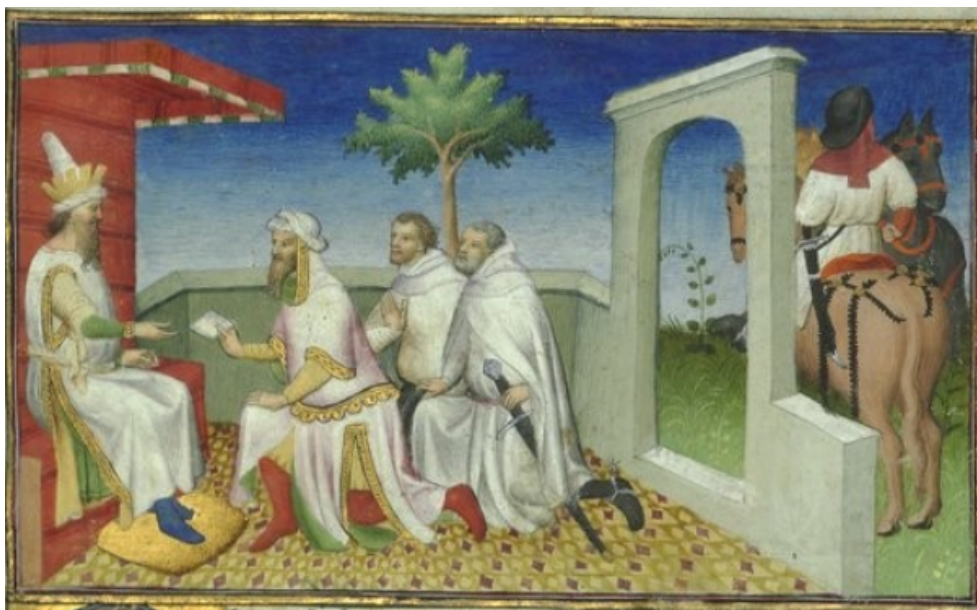
Fig. 4. Maître de la Mazarine et ses collaborateurs, Les deux frères Niccolò et Matteo Polo avec le messager du Khan , 1410-1412. Miniature polychromée, 81/112 x 160/162 mm, Paris, Bibliothèque nationale de France, BNF ms. fr. 2810, folio 3r.