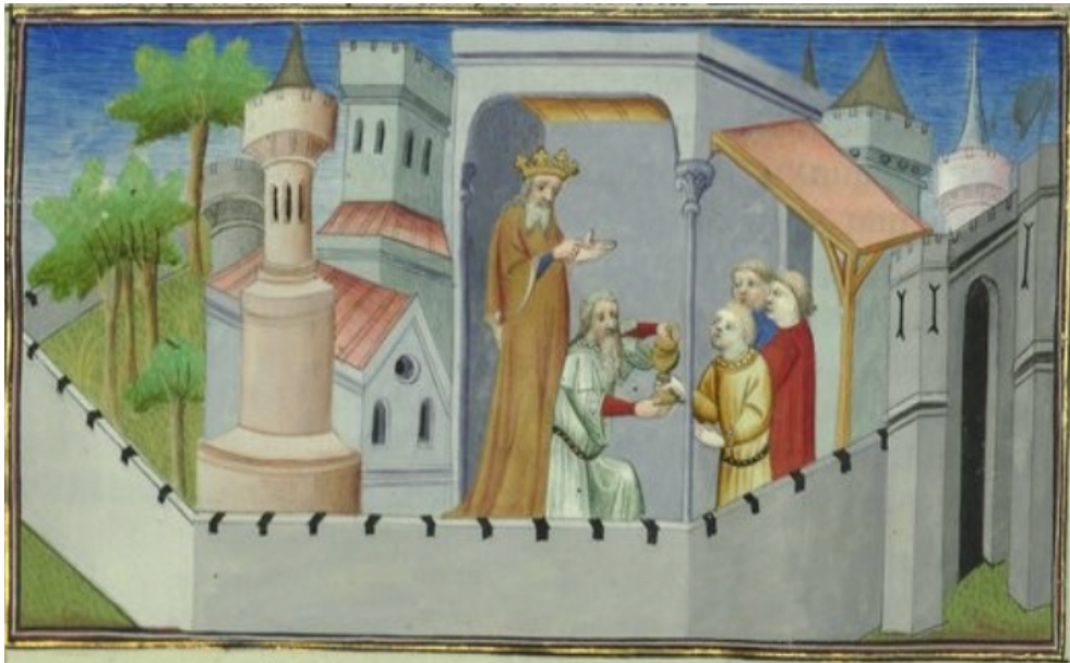
Fig. 22. Maître d'Egerton et Maître de la tendance de Bedford avec leurs collaborateurs, Coutumes et pratiques du Vieux de la Montagne , 1410-1412. Miniature polychromée, 81/112 x 160/162 mm, Paris, Bibliothèque nationale de France, BNF ms. fr. 2810, folio 17r.