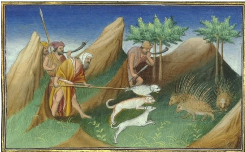
Fig. 23. Maître de la Mazarine et ses collaborateurs, Chasse aux porcs-épics , 1410-1412. Miniature polychromée, 81/112 x 160/162 mm, Paris, Bibliothèque nationale de France, BNF ms. fr. 2810, folio 18r.