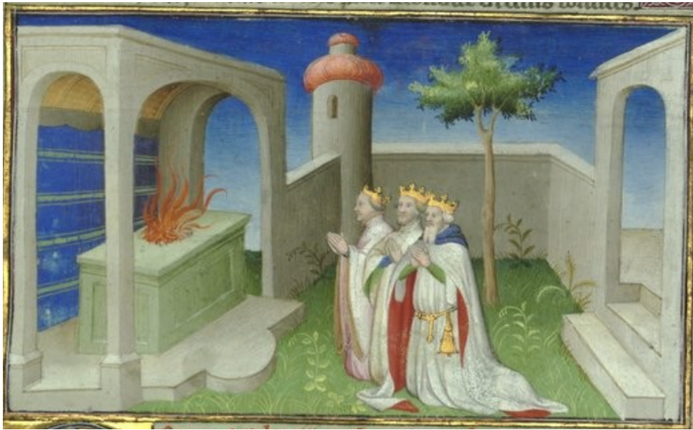
Fig. 16. Maître de la Mazarine et ses collaborateurs, Comment les trois rois jetèrent la pierre au puit , 1410-1412. Miniature polychromée, 81/112 x 160/162 mm, Paris, Bibliothèque nationale de France, BNF ms. fr. 2810, folio 12r.