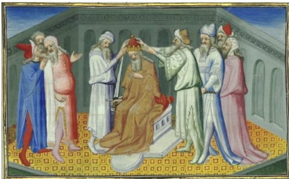
Fig. 31. Maître d'Egerton et Maître de la tendance de Bedford avec leurs collaborateurs, Couronnement du premier Khan des tartares , 1410-1412. Miniature polychromée, 81/112 x 160/162 mm, Paris, Bibliothèque nationale de France, BNF ms. fr. 2810, folio 25v.