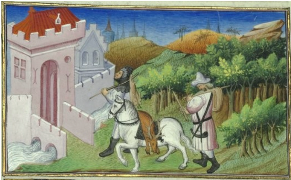
Fig. 62. Maître d'Egerton et Maître de la tendance de Bedford avec leurs collaborateurs, Retour de chasse à la cité de Lingny Matu , 1410-1412. Miniature polychromée, 81/112 x 160/162 mm, Paris, Bibliothèque nationale de France, BNF ms. fr. 2810, folio 62v.