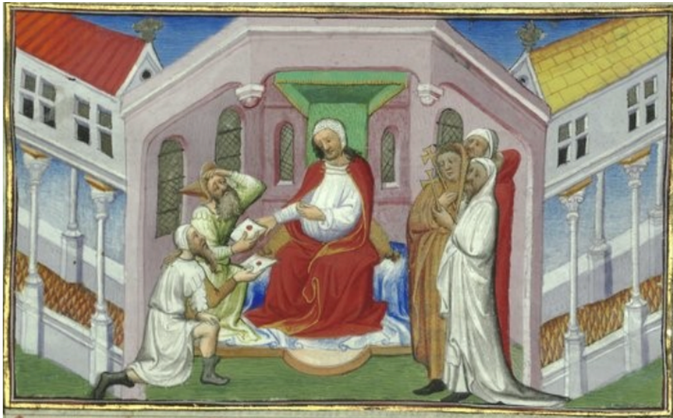
Fig. 32. Maître d'Egerton et Maître de la tendance de Bedford avec leurs collaborateurs, Messagers en visite au prêtre Jehan , 1410-1412. Miniature polychromée, 81/112 x 160/162 mm, Paris, Bibliothèque nationale de France, BNF ms. fr. 2810, folio 26r.