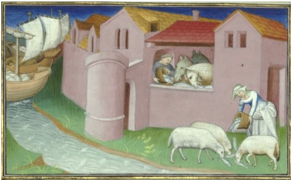
Fig. 81. Maître de la Mazarine et ses collaborateurs, Province de Taten , 1410-1412. Miniature polychromée, 81/112 x 160/162 mm, Paris, Bibliothèque nationale de France, BNF ms. fr. 2810, folio 91r.