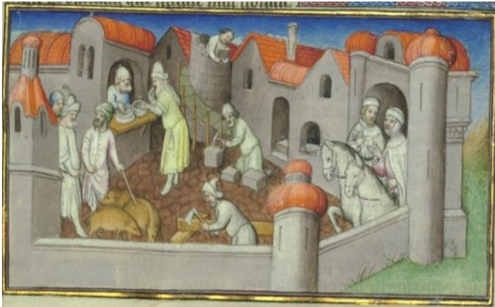
Fig. 10. Maître de la Mazarine et ses collaborateurs, Métiers et organisation de la ville orientale , 1410-1412. Miniature polychromée, 81/112 x 160/162 mm, Paris, Bibliothèque nationale de France, BNF ms. fr. 2810, folio 7r.