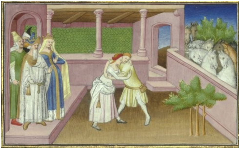
Fig. 84. Maître de la Mazarine et ses collaborateurs, Comment Alaga envoya son fils faire la guerre contre le roi Caidu , 1410-1412. Miniature polychromée, 81/112 x 160/162 mm, Paris, Bibliothèque nationale de France, BNF ms. fr. 2810, folio 95v.