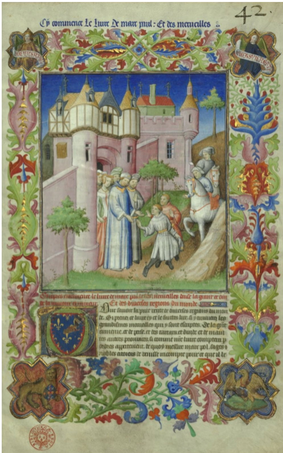
Fig. 1. Maître de la Mazarine et ses collaborateurs, Page de frontispice , 1410-1412. Miniature polychromée, 189 x 160 mm, Paris, Bibliothèque nationale de France, BNF ms. fr. 2810, folio 1r.