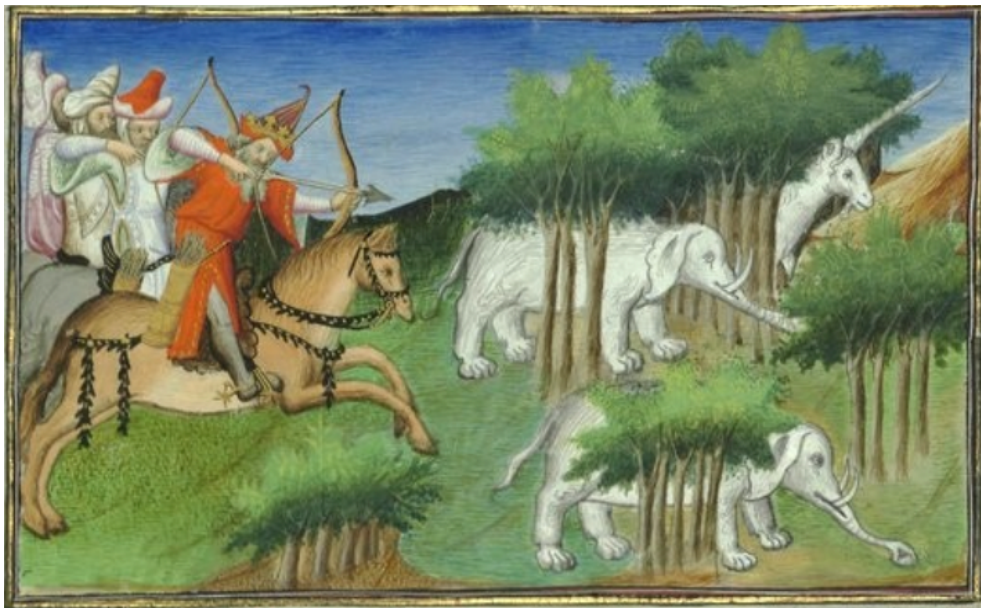
Fig. 59. Maître d'Egerton et Maître de la tendance de Bedford avec leurs collaborateurs, Chasse à l'éléphant et à la licorne , 1410-1412. Miniature polychromée, 81/112 x 160/162 mm, Paris, Bibliothèque nationale de France, BNF ms. fr. 2810, folio 59r.