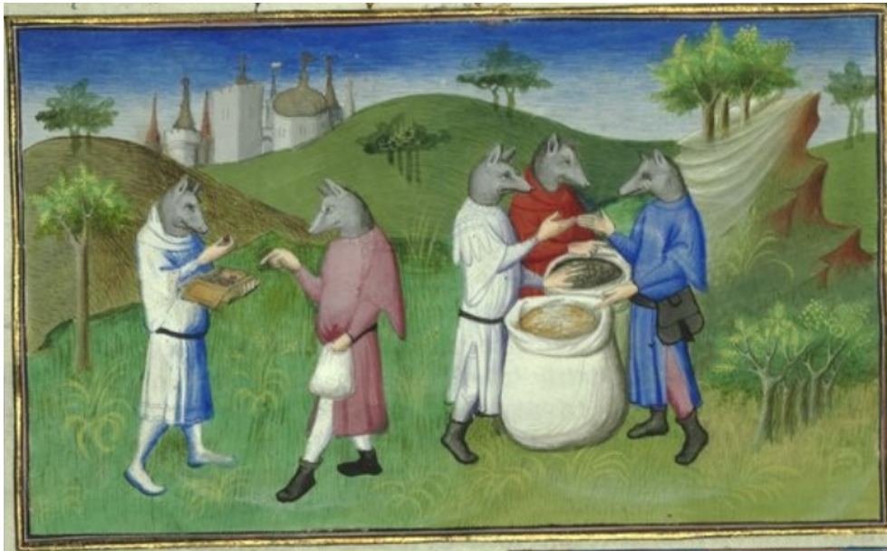
Fig. 70. Maître d'Egerton et Maître de la tendance de Bedford avec leurs collaborateurs, Peuple de la ville de Seilan , 1410-1412. Miniature polychromée, 81/112 x 160/162 mm, Paris, Bibliothèque nationale de France, BNF ms. fr. 2810, folio 76v.