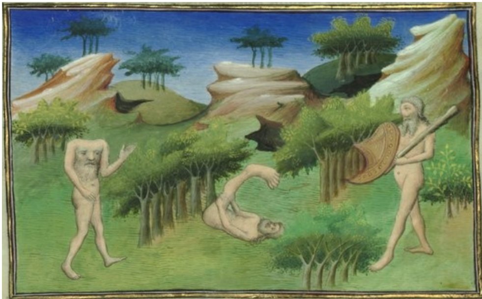
Fig. 35. Maître d'Egerton et Maître de la tendance de Bedford avec leurs collaborateurs, Royaume Teerguiul , 1410-1412. Miniature polychromée, 81/112 x 160/162 mm, Paris, Bibliothèque nationale de France, BNF ms. fr. 2810, folio 29v.