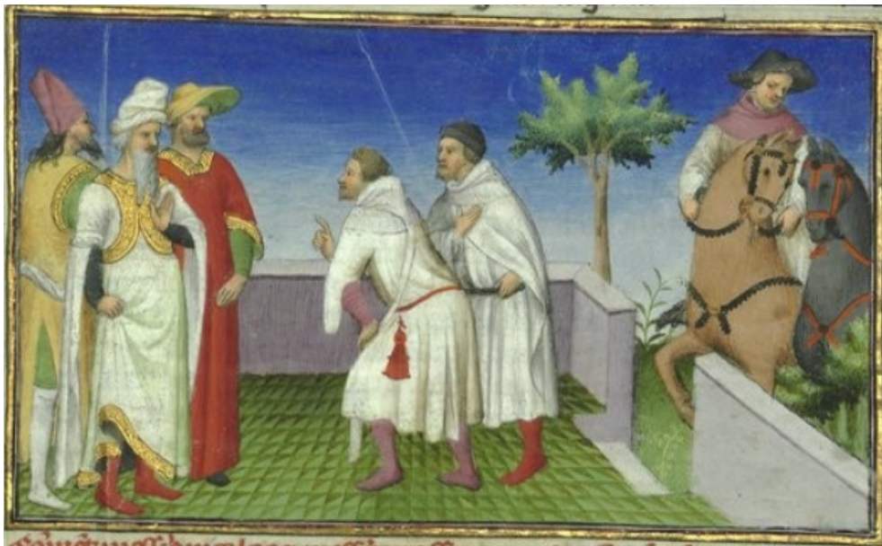
Fig. 9. Maître de la Mazarine et ses collaborateurs, Négociation avec la famille Polo , 1410-1412. Miniature polychromée, 81/112 x 160/162 mm, Paris, Bibliothèque nationale de France, BNF ms. fr. 2810, folio 6r.