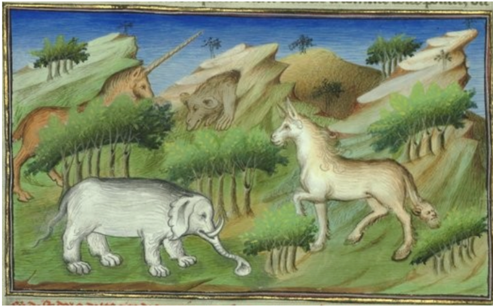
Fig. 60. Maître d'Egerton et Maître de la tendance de Bedford avec leurs collaborateurs, Cité de Taurien , 1410-1412. Miniature polychromée, 81/112 x 160/162 mm, Paris, Bibliothèque nationale de France, BNF ms. fr. 2810, folio 59v.