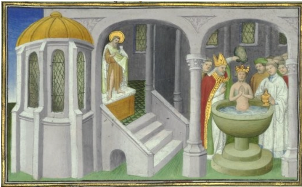
Fig. 26. Maître de la Mazarine et ses collaborateurs, Royaume de Caftar , 1410-1412. Miniature polychromée, 81/112 x 160/162 mm, Paris, Bibliothèque nationale de France, BNF ms. fr. 2810, folio 20v.