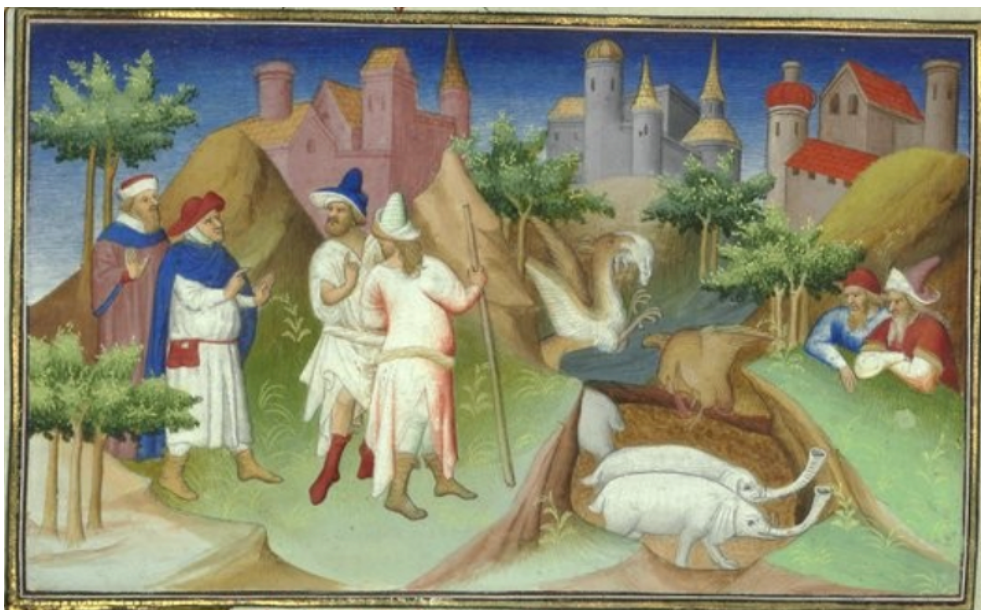
Fig. 79. Maître de la Mazarine et ses collaborateurs, Ville de Mateilgalsax , 1410-1412. Miniature polychromée, 81/112 x 160/162 mm, Paris, Bibliothèque nationale de France, BNF ms. fr. 2810, folio 88r.