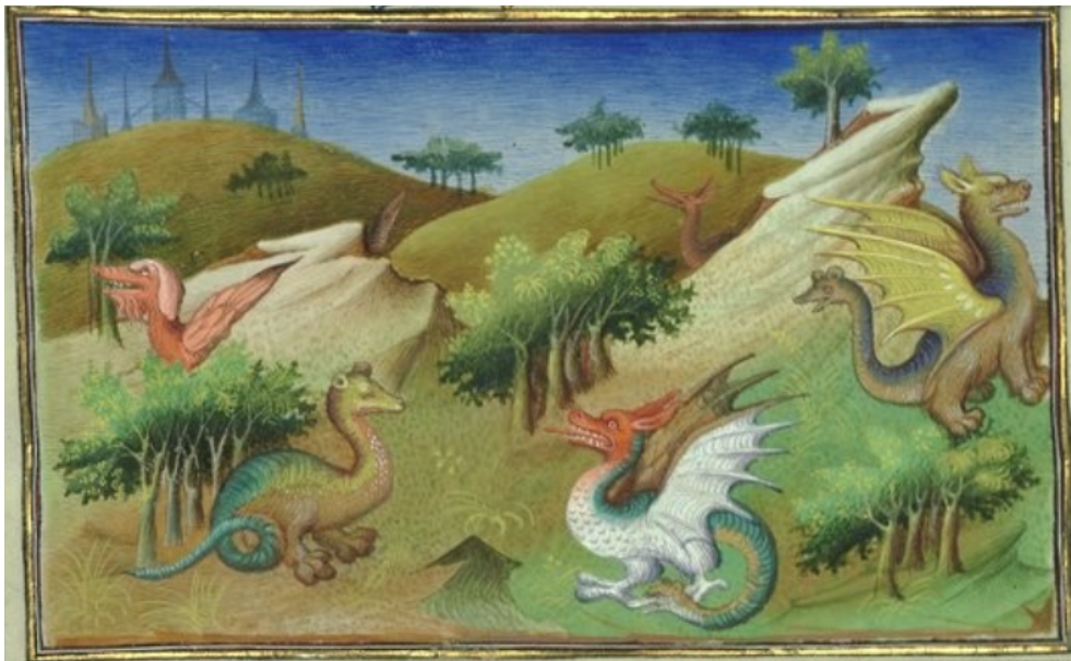
Fig. 57. Maître d'Egerton et Maître de la tendance de Bedford avec leurs collaborateurs, Province de Caranian , 1410-1412. Miniature polychromée, 81/112 x 160/162 mm, Paris, Bibliothèque nationale de France, BNF ms. fr. 2810, folio 55v.