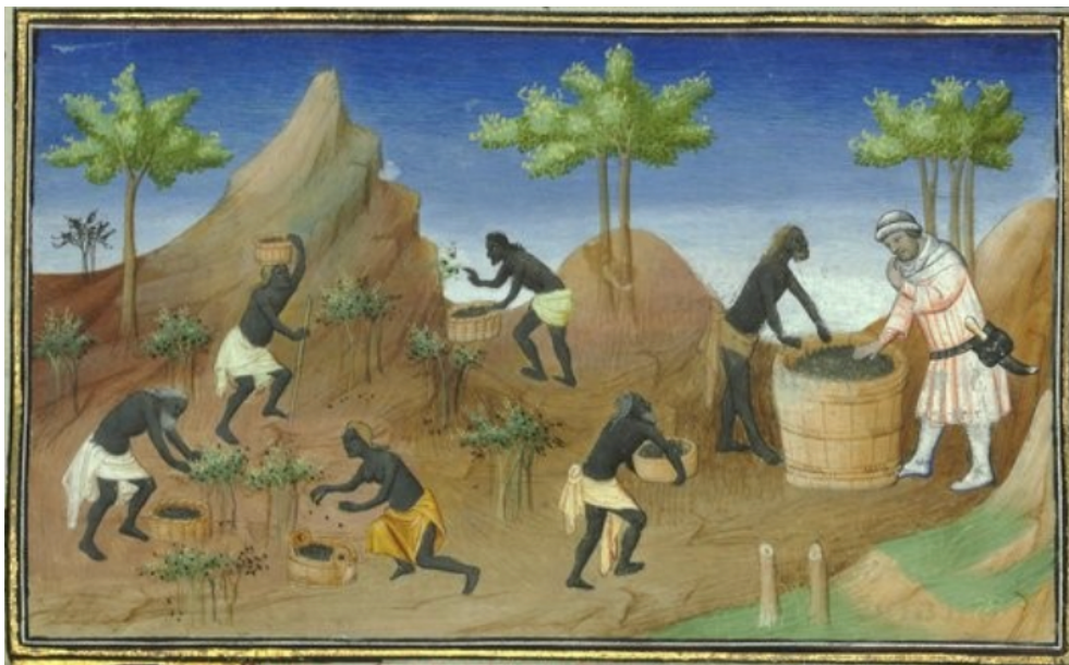
Fig. 75. Maître de la Mazarine et ses collaborateurs, Peuple de la ville de Qilil , 1410-1412. Miniature polychromée, 81/112 x 160/162 mm, Paris, Bibliothèque nationale de France, BNF ms. fr. 2810, folio 84r.