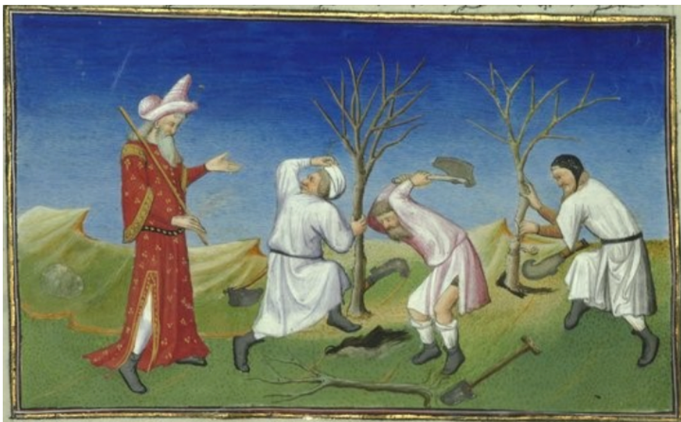
Fig. 51. Maître d'Egerton et Maître de la tendance de Bedford avec leurs collaborateurs, Visite du Khan sur ses terres et aux paysans , 1410-1412. Miniature polychromée, 81/112 x 160/162 mm, Paris, Bibliothèque nationale de France, BNF ms. fr. 2810, folio 47v.