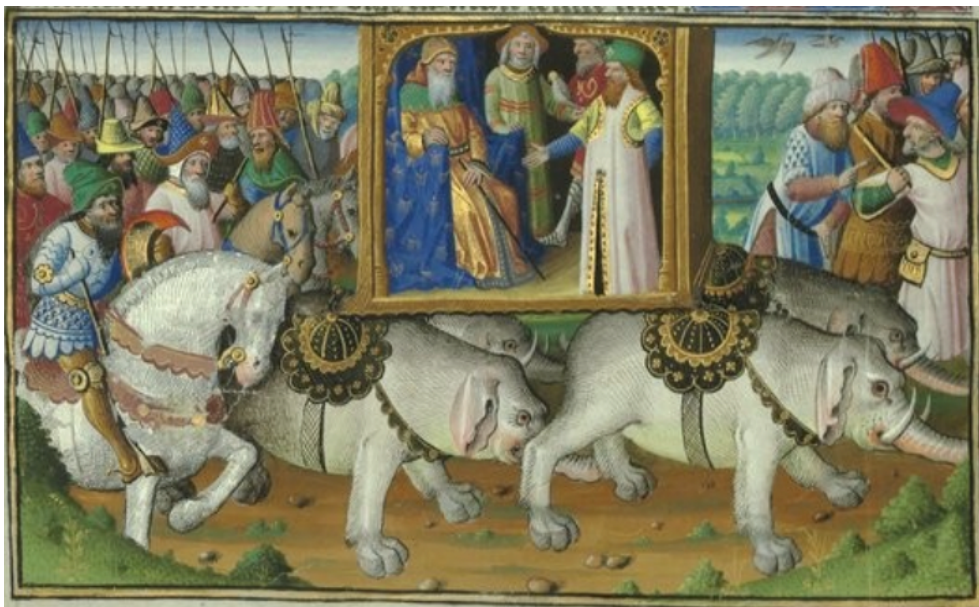
Fig. 47. Evrard d'Espinque, Le Khan et sa cour à la chasse , 1470. Miniature polychromée, 81/112 x 160/162 mm, Paris, Bibliothèque nationale de France, BNF ms. fr. 2810, folio 42v.