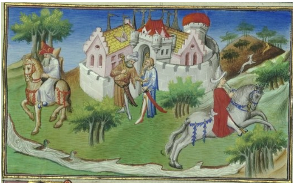
Fig. 42. Maître d'Egerton et Maître de la tendance de Bedford avec leurs collaborateurs, Palais du fils du Khan , 1410-1412. Miniature polychromée, 81/112 x 160/162 mm, Paris, Bibliothèque nationale de France, BNF ms. fr. 2810, folio 38r.