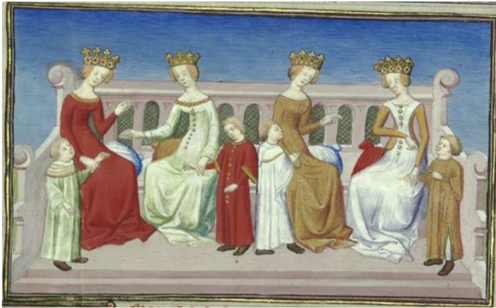
Fig. 40. Maître d'Egerton et Maître de la tendance de Bedford avec leurs collaborateurs, Cour du Khan avec femmes et enfants , 1410-1412. Miniature polychromée, 81/112 x 160/162 mm, Paris, Bibliothèque nationale de France, BNF ms. fr. 2810, folio 36r.