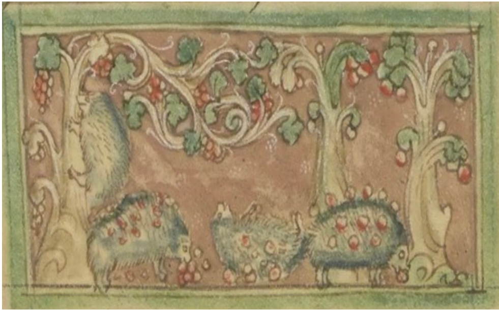
Fig. 7. Maître inconnu, Les hérissons récoltant les raisins , vers 1270. Miniature polychromée, 215 x 145 mm, Paris, Bibliothèque nationale de France, BNF ms. fr. 14.969, folio 21v.