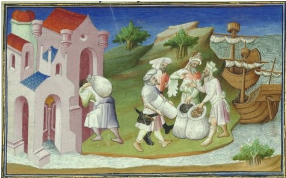
Fig. 54. Maître d'Egerton et Maître de la tendance de Bedford avec leurs collaborateurs, Acheminement des denrées sur le fleuve Caramæam , 1410-1412. Miniature polychromée, 81/112 x 160/162 mm, Paris, Bibliothèque nationale de France, BNF ms. fr. 2810, folio 51r.