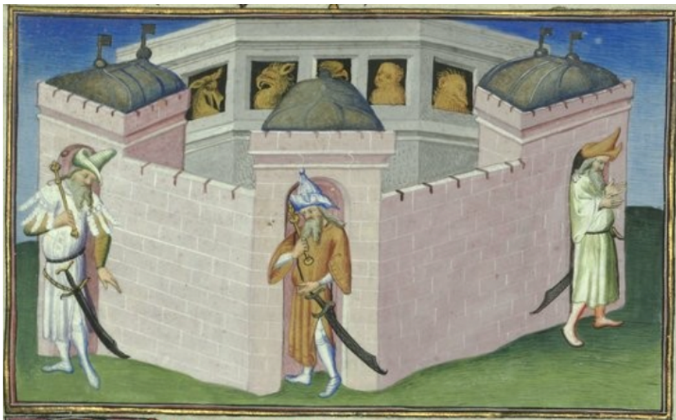
Fig. 41. Maître d'Egerton et Maître de la tendance de Bedford avec leurs collaborateurs, Palais du Khan , 1410-1412. Miniature polychromée, 81/112 x 160/162 mm, Paris, Bibliothèque nationale de France, BNF ms. fr. 2810, folio 37r.