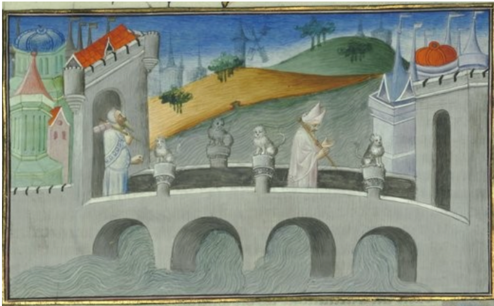
Fig. 52. Maître d'Egerton et Maître de la tendance de Bedford avec leurs collaborateurs, Entrée fortifiée de la province de Catay , 1410-1412. Miniature polychromée, 81/112 x 160/162 mm, Paris, Bibliothèque nationale de France, BNF ms. fr. 2810, folio 49r.