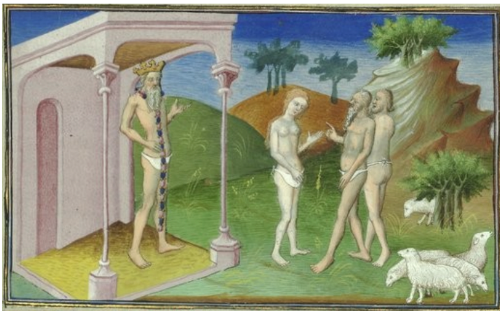
Fig. 71. Maître d'Egerton et Maître de la tendance de Bedford avec leurs collaborateurs, Province de Maabar , 1410-1412. Miniature polychromée, 81/112 x 160/162 mm. Paris, Bibliothèque nationale de France, BNF ms. fr. 2810, folio 78r.