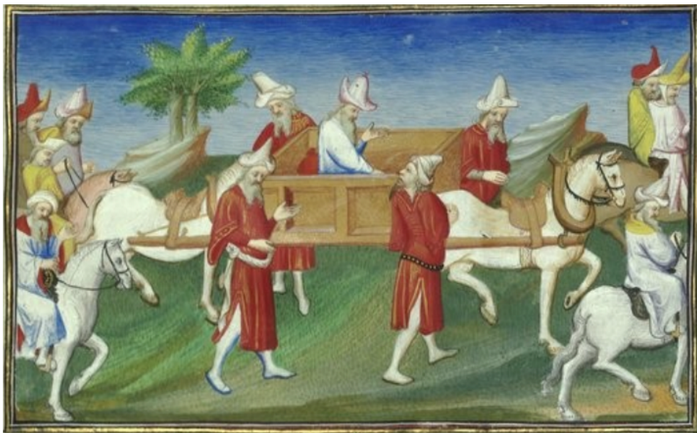
Fig. 45. Maître d'Egerton et Maître de la tendance de Bedford avec leurs collaborateurs, Cortège du Khan et de ses seigneurs , 1410-1412. Miniature polychromée, 81/112 x 160/162 mm, Paris, Bibliothèque nationale de France, BNF ms. fr. 2810, folio 41r.