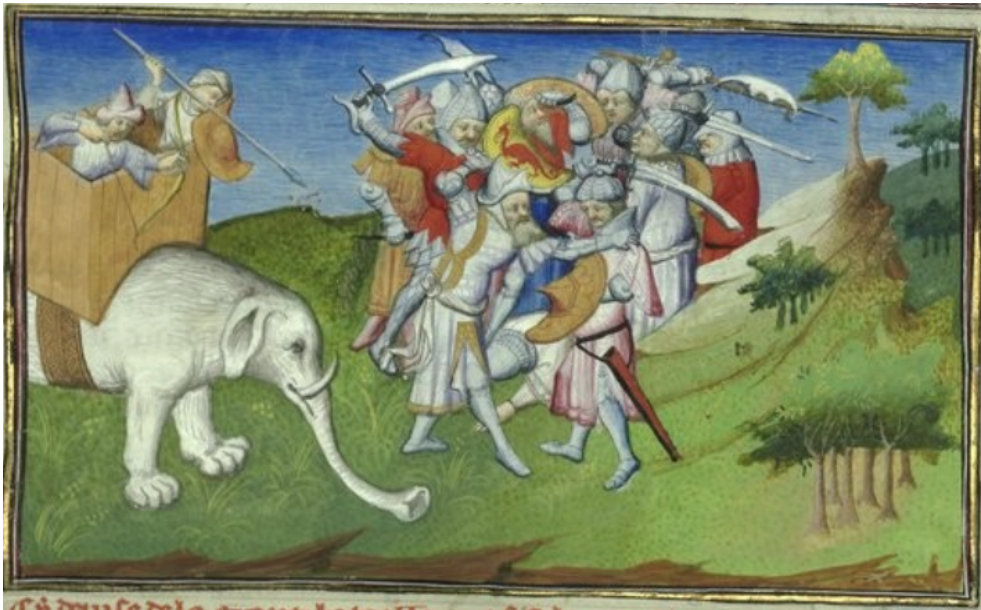
Fig. 38. Maître d'Egerton et Maître de la tendance de Bedford avec leurs collaborateurs, Bataille du Khan contre Nayan , 1410-1412. Miniature polychromée, 81/112 x 160/162 mm, Paris, Bibliothèque nationale de France, BNF ms. fr. 2810, folio 33r.