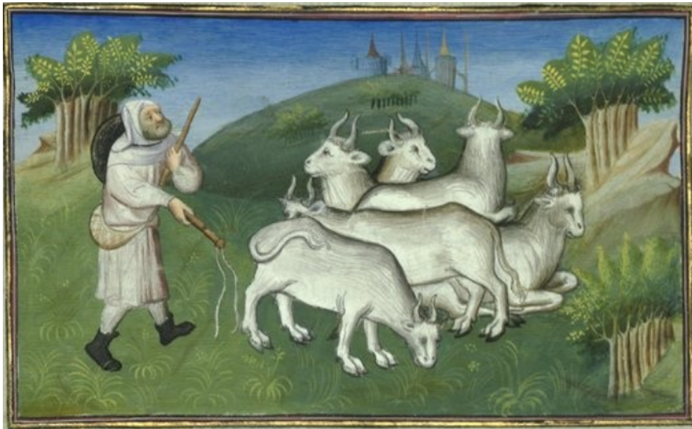
Fig. 36. Maître d'Egerton et Maître de la tendance de Bedford avec leurs collaborateurs, Province de Tanduc , 1410-1412. Miniature polychromée, 81/112 x 160/162 mm, Paris, Bibliothèque nationale de France, BNF ms. fr. 2810, folio 30v.