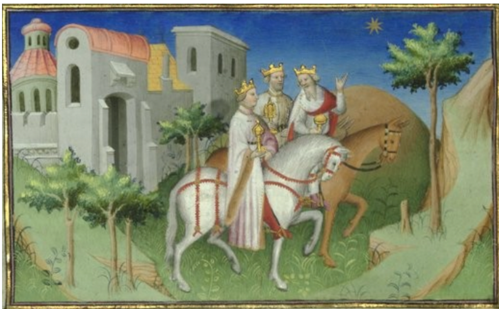
Fig. 15. Maître de la Mazarine et ses collaborateurs, Les trois rois de la région de Faba , 1410-1412. Miniature polychromée, 81/112 x 160/162 mm, Paris, Bibliothèque nationale de France, BNF ms. fr. 2810, folio 11v.