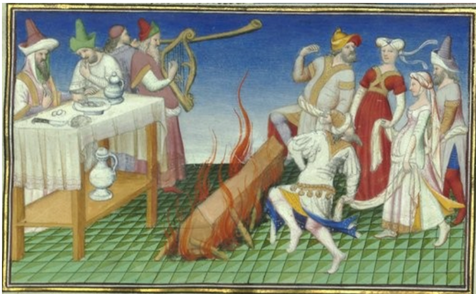
Fig. 29. Maître de la Mazarine et ses collaborateurs, Rituel funéraire , 1410-1412. Miniature polychromée, 81/112 x 160/162 mm, Paris, Bibliothèque nationale de France, BNF ms. fr. 2810, folio 23r.