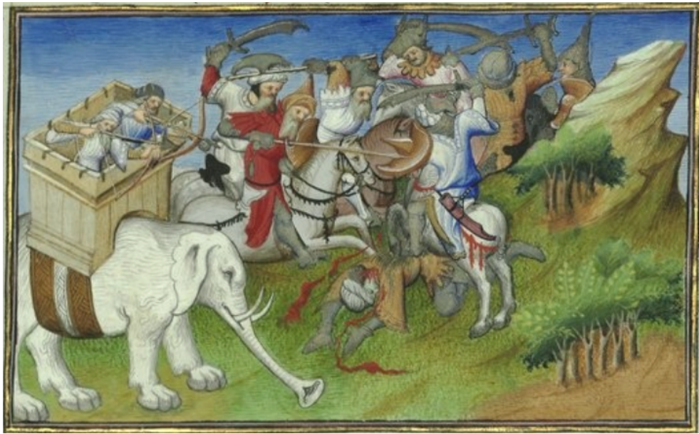
Fig. 58. Maître d'Egerton et Maître de la tendance de Bedford avec leurs collaborateurs, Bataille entre le Khan et le roi de Mien , 1410-1412. Miniature polychromée, 81/112 x 160/162 mm, Paris, Bibliothèque nationale de France, BNF ms. fr. 2810, folio 58r.