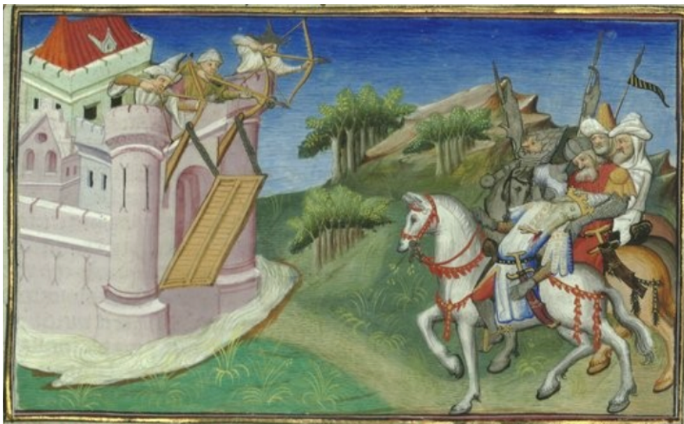
Fig. 33. Maître d'Egerton et Maître de la tendance de Bedford avec leurs collaborateurs, Bataille entre le Khan et le prêtre Jehan , 1410-1412. Miniature polychromée, 81/112 x 160/162 mm, Paris, Bibliothèque nationale de France, BNF ms. fr. 2810, folio 27r.