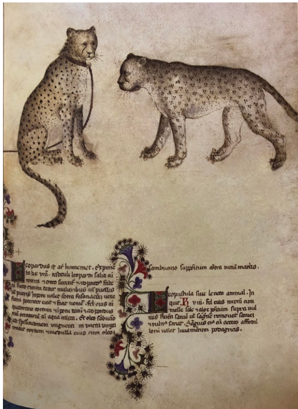
Fig. 4. Maître inconnu, La panthère attirant les animaux avec son haleine , fin du XIII e siècle. Miniature polychromée, 180 x 144 mm, Paris, Bibliothèque nationale de France, BNF ms. lat. 3.630, folio 76.