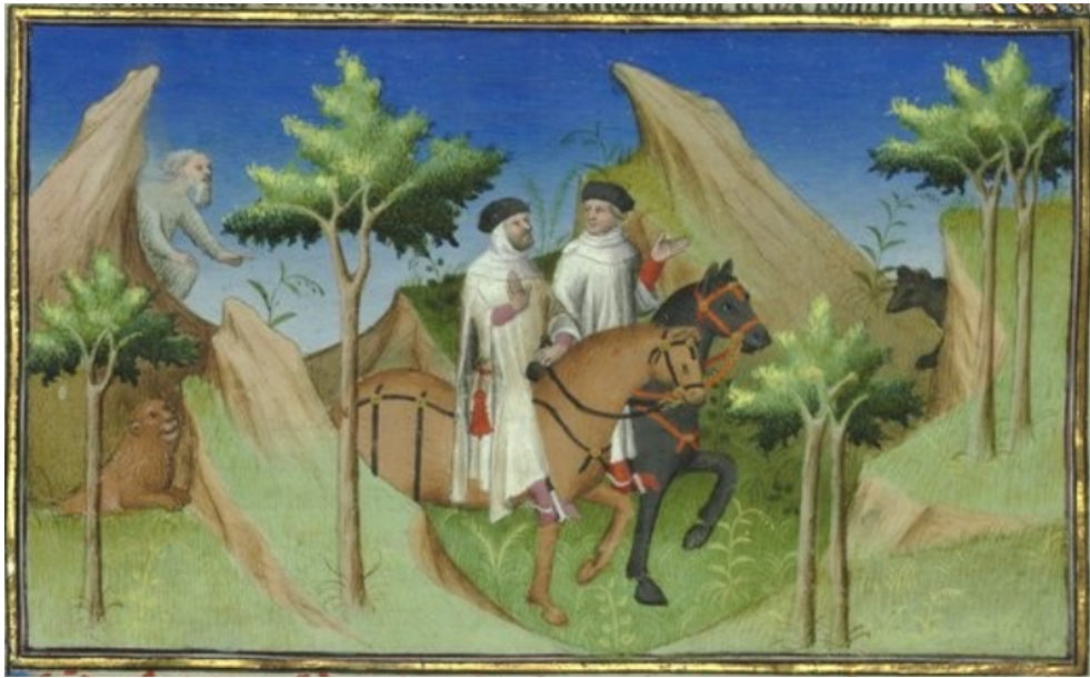
Fig. 20. Maître de la Mazarine et ses collaborateurs, Visite de Marco Polo de la nature et des merveilles qui s'y trouvent , 1410-1412. Miniature polychromée, 81/112 x 160/162 mm, Paris, Bibliothèque nationale de France, BNF ms. fr. 2810, folio 15v.