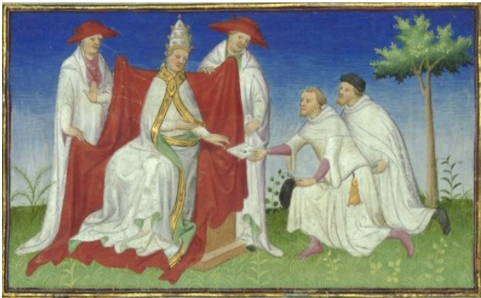
Fig. 7. Maître de la Mazarine et ses collaborateurs, Remise de la lettre , 1410-1412. Miniature polychromée, 81/112 x 160/162 mm, Paris, Bibliothèque nationale de France, BNF ms. fr. 2810, folio 4v.