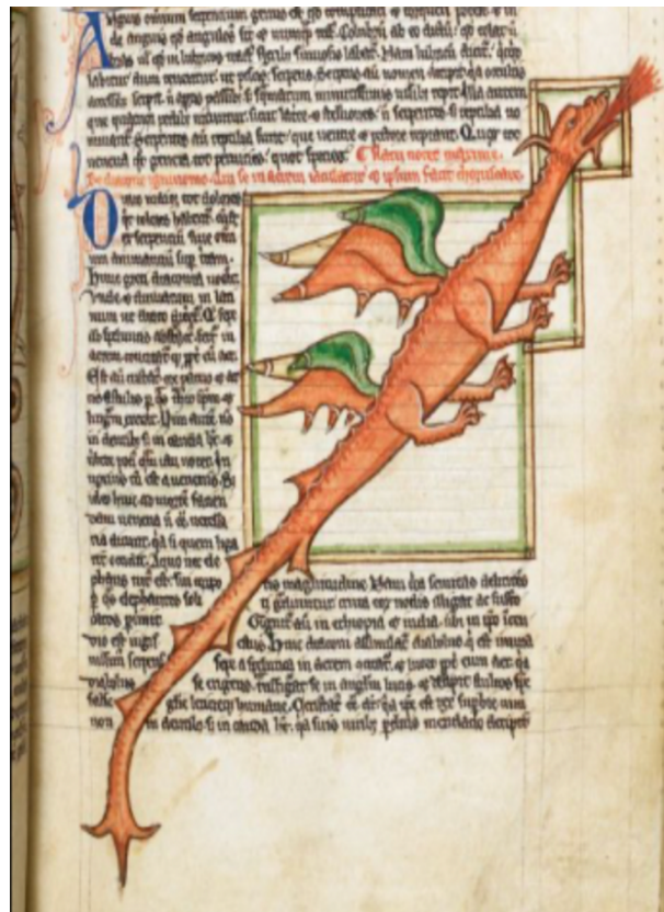
Fig. 12. Maître inconnu, Dragon , 1236-1250. Miniature polychromée, 280 x 165 mm, Londres, The British Library, MS. Harley 3244, folio 59.