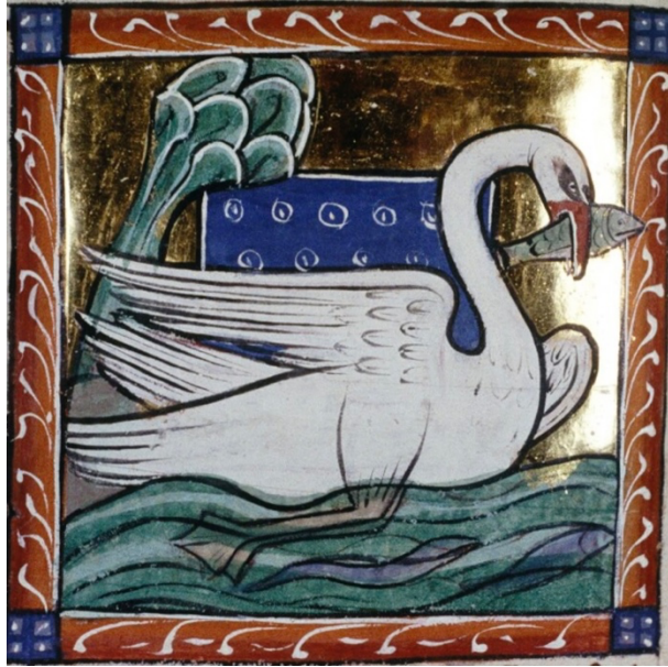
Fig. 3. Maître inconnu, Cygne , 1240. Miniature polychromée, dimensions inconnues, Oxford, The Bodleian Library, MS. Bodley 764, folio 65.