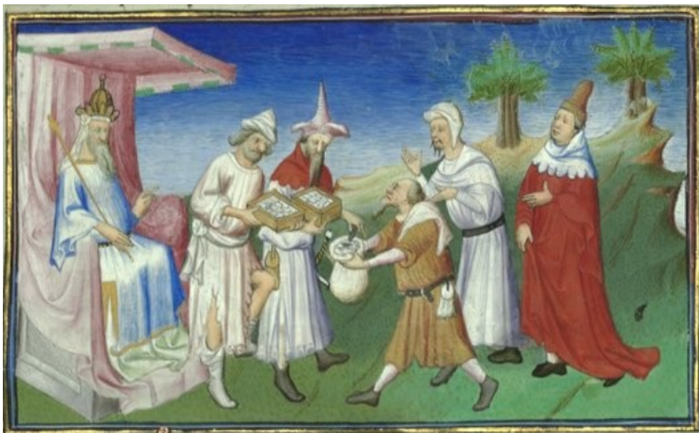
Fig. 49. Maître d'Egerton et Maître de la tendance de Bedford avec leurs collaborateurs, Utilisation de la monnaie du territoire mongol , 1410-1412. Miniature polychromée, 81/112 x 160/162 mm, Paris, Bibliothèque nationale de France, BNF ms. fr. 2810, folio 45r.