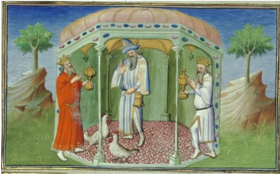
Fig. 66. Maître d'Egerton et Maître de la tendance de Bedford avec leurs collaborateurs, Entrée en Inde et début de ses merveilles , 1410-1412. Miniature polychromée, 81/112 x 160/162 mm, Paris, Bibliothèque nationale de France, BNF ms. fr. 2810, folio 71r.