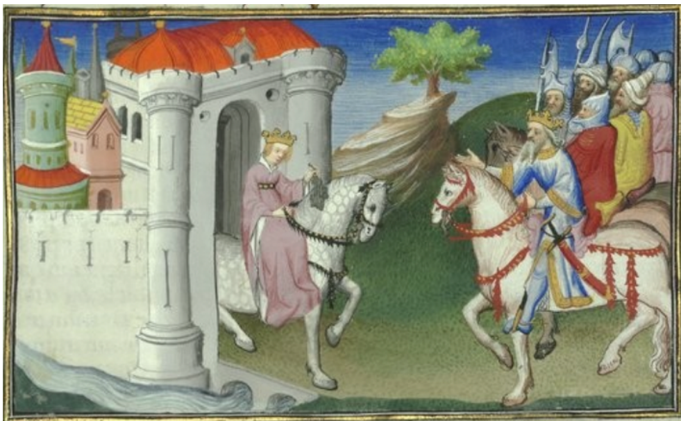
Fig. 63. Maître d'Egerton et Maître de la tendance de Bedford avec leurs collaborateurs, Conquête de la province de Mangy par le Khan , 1410-1412. Miniature polychromée, 81/112 x 160/162 mm, Paris, Bibliothèque nationale de France, BNF ms. fr. 2810, folio 64r.