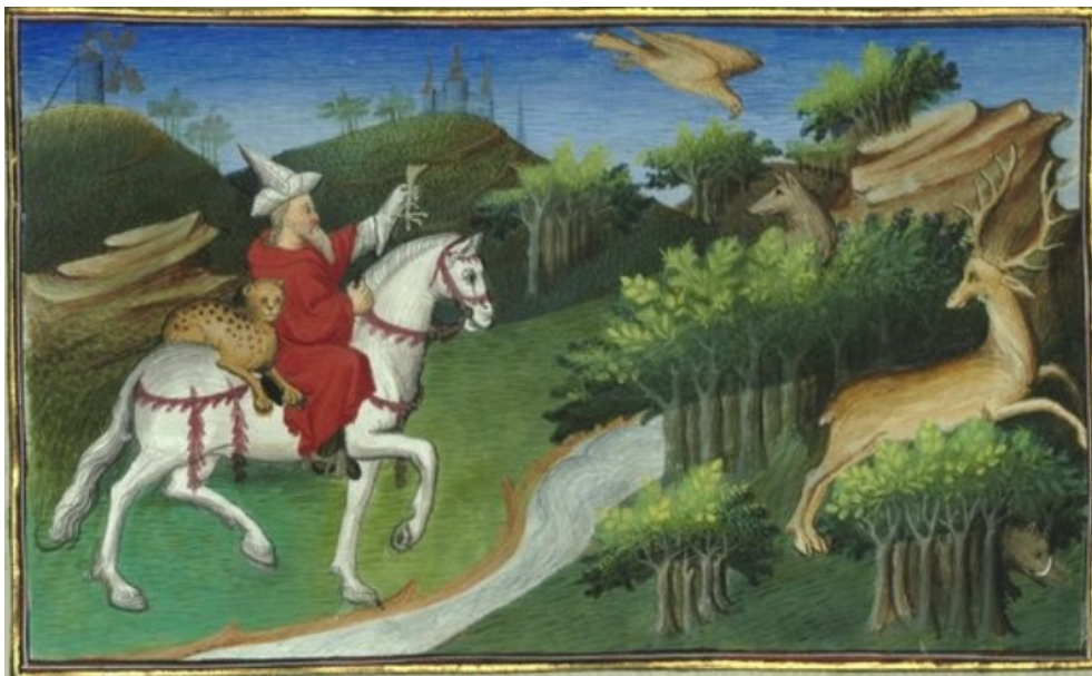
Fig. 37. Maître d'Egerton et Maître de la tendance de Bedford avec leurs collaborateurs, Chasse du Khan dans la cité de Cyandu , 1410-1412. Miniature polychromée, 81/112 x 160/162 mm, Paris, Bibliothèque nationale de France, BNF ms. fr. 2810, folio 31v.