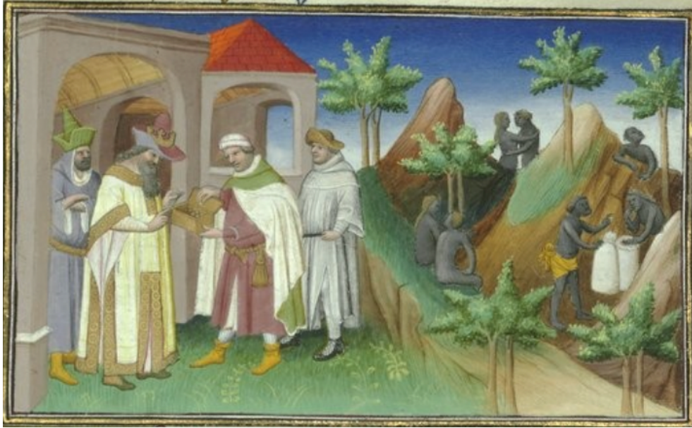
Fig. 74. Maître de la Mazarine et ses collaborateurs, Province de Lax , 1410-1412. Miniature polychromée, 81/112 x 160/162 mm, Paris, Bibliothèque nationale de France, BNF ms. fr. 2810, folio 83r.