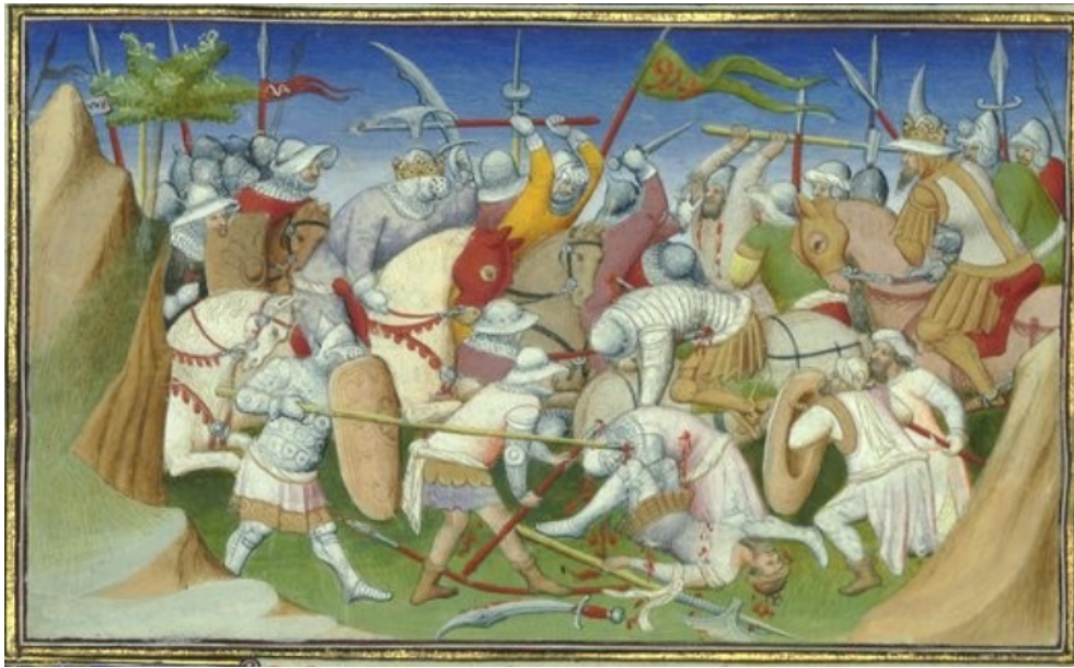
Fig. 80. Maître de la Mazarine et ses collaborateurs, Province de Tallalie , 1410-1412. Miniature polychromée, 81/112 x 160/162 mm, Paris, Bibliothèque nationale de France, BNF ms. fr. 2810, folio 89v.