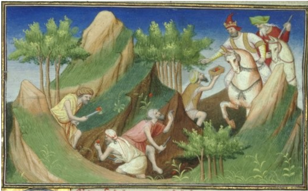
Fig. 24. Maître de la Mazarine et ses collaborateurs, Province de Balauam , 1410-1412. Miniature polychromée, 81/112 x 160/162 mm, Paris, Bibliothèque nationale de France, BNF ms. fr. 2810, folio 18v.