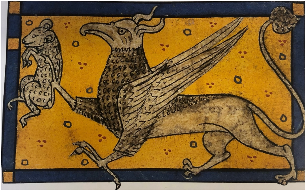
Fig. 11. Maître inconnu, Griffon et sa proie , XIII e siècle. Miniature polychromée, dimensions inconnues, Paris, Bibliothèque nationale de France, BNF ms. lat. 3630, folio 77.