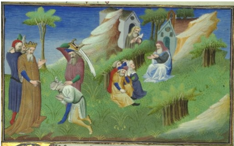
Fig. 25. Maître d' Egerton et Maître de la tendance de Bedford avec leurs collaborateurs, Province de Debuntur , 1410-1412. Miniature polychromée, 81/112 x 160/162 mm, Paris, Bibliothèque nationale de France, BNF ms. fr. 2810, folio 19v.