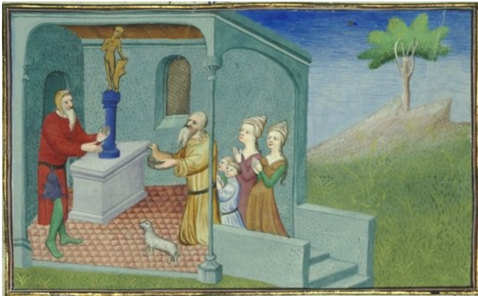
Fig. 28. Maître d'Egerton et Maître de la tendance de Bedford avec leurs collaborateurs, Province de Tangat , 1410-1412. Miniature polychromée, 81/112 x 160/162 mm, Paris, Bibliothèque nationale de France, BNF ms. fr. 2810, folio 22v.