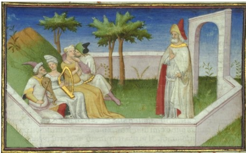
Fig. 21. Maître de la Mazarine et ses collaborateurs, Siège du Vieux de la Montagne , 1410-1412. Miniature polychromée, 81/112 x 160/162 mm, Paris, Bibliothèque nationale de France, BNF ms. fr. 2810, folio 16v.