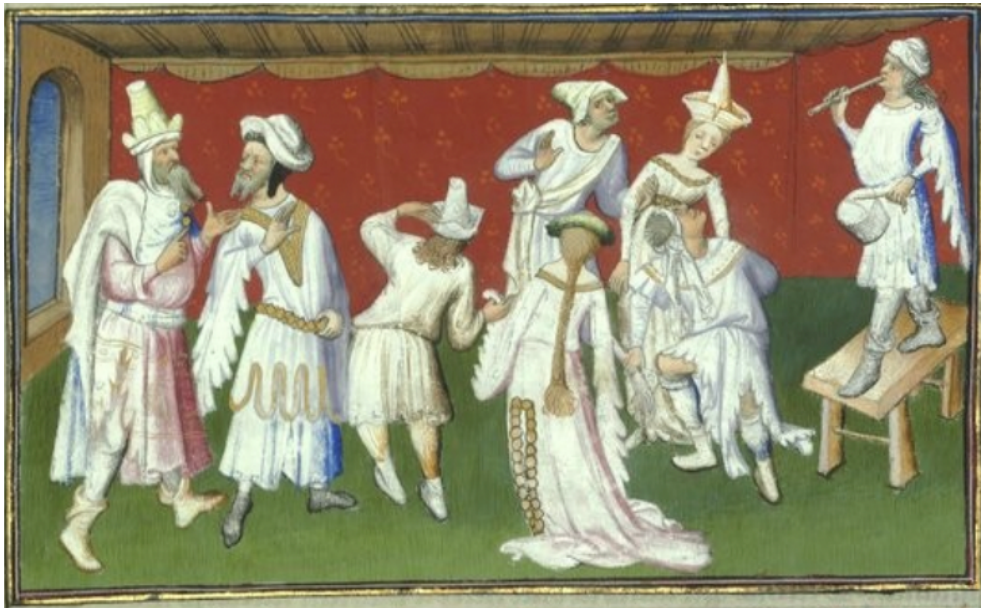
Fig. 48. Maître d'Egerton et Maître de la tendance de Bedford avec leurs collaborateurs, Le retour de chasse , 1410-1412. Miniature polychromée, 81/112 x 160/162 mm, Paris, Bibliothèque nationale de France, BNF ms. fr. 2810, folio 44r.