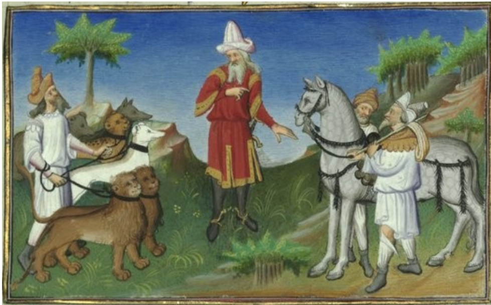
Fig. 46. Maître d'Egerton et Maître de la tendance de Bedford avec leurs collaborateurs, Choix des animaux pour la chasse , 1410-1412. Miniature polychromée, 81/112 x 160/162 mm, Paris, Bibliothèque nationale de France, BNF ms. fr. 2810, folio 42r.