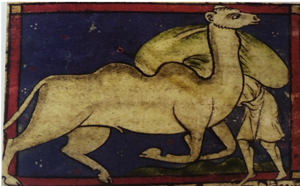
Fig. 8. Maître inconnu, Le chameau , troisième quart du XIII e siècle. Miniature polychromée, 245 x 203 mm, Paris, Bibliothèque nationale de France, BNF ms. lat. 3.630, folio 83v.