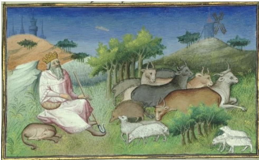
Fig. 53. Maître d'Egerton et Maître de la tendance de Bedford avec leurs collaborateurs, Jadis le roi de Catay , 1410-1412. Miniature polychromée, 81/112 x 160/162 mm, Paris, Bibliothèque nationale de France, BNF ms. fr. 2810, folio 50r.