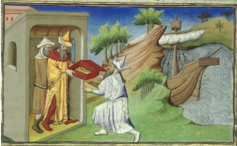
Fig. 34. Maître d'Egerton et Maître de la tendance de Bedford avec leurs collaborateurs, Offrande au dieu des tartares , 1410-1412. Miniature polychromée, 81/112 x 160/162 mm, Paris, Bibliothèque nationale de France, BNF ms. fr. 2810, folio 28r.