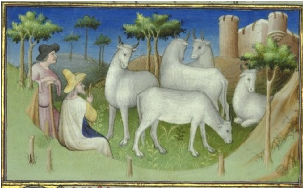
Fig. 18. Maître de la Mazarine et ses collaborateurs, Dune de Samadi , 1410-1412. Miniature polychromée, 81/112 x 160/162 mm, Paris, Bibliothèque nationale de France, BNF ms. fr. 2810, folio 13v.