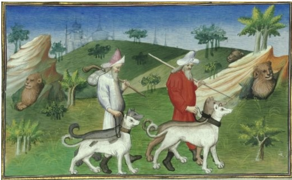
Fig. 61. Maître d'Egerton et Maître de la tendance de Bedford avec leurs collaborateurs, Chasse dans la province de Dalomain , 1410-1412. Miniature polychromée, 81/112 x 160/162 mm, Paris, Bibliothèque nationale de France, BNF ms. fr. 2810, folio 61r.