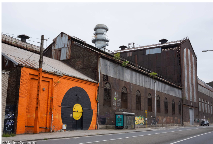
Rockerill 2020 (Marine Calandre)