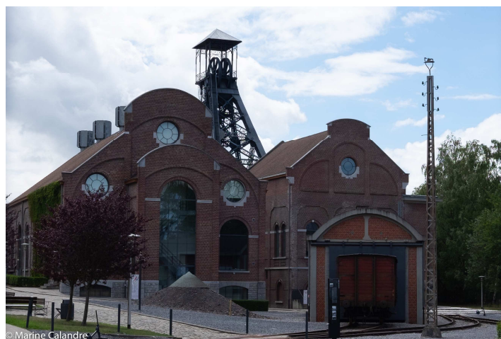
Bois du Cazier 2020 (Marine Calandre)

Pour mener à bien la rénovation, la Ville a dû faire quelques sacrifices. Par exemple, le plus haut bâtiment du site, la tour Foraky a été un sujet de discorde. Le choix de sa destruction a dû être assumé par la Ville en 2003 pour des raisons financières, comme exposé dans un article de la DH : « Depuis un an maintenant, le pouvoir politique ne parle plus qu'en terme de dépense. La démolition de la tour ne coûterait selon une estimation avancée il y a un an par Igretec 16 que 300.000 euros. Sa sécurisation reviendrait à un peu moins d'1,5 millions d'euros et sa réhabilitation prendrait la totalité de l'enveloppe consacrée au Phasing out. 17 »