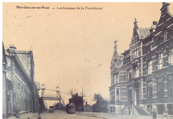
Marchienne-au-pont, les bureaux de la Providence