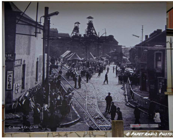
Aout 1956, après la catastrophe