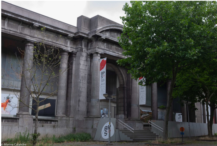
BPS22 2020 (Marine Calandre)

« Le principe fondateur de l'action du BPS22 est l'élévation sociale par l'accession à la culture, considérée comme une forme "d'approfondissement de la démocratie". Elle est un vecteur essentiel de démocratie qui permet aux citoyens d'appréhender de manière plus critique le monde dans lequel ils vivent. » 29