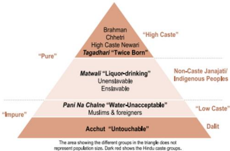
Tableau 1. La pyramide népalaise des castes selon le Muluki Ain en 1854

Au sommet de la pyramide, on retrouve les Tagadhari (« deux fois nés », castes portant le fil sacré), à savoir les Brahmanes, les Chhetris, les Adivasi et les Janjati. Ces derniers gouvernent les castes inférieures de génération en génération.