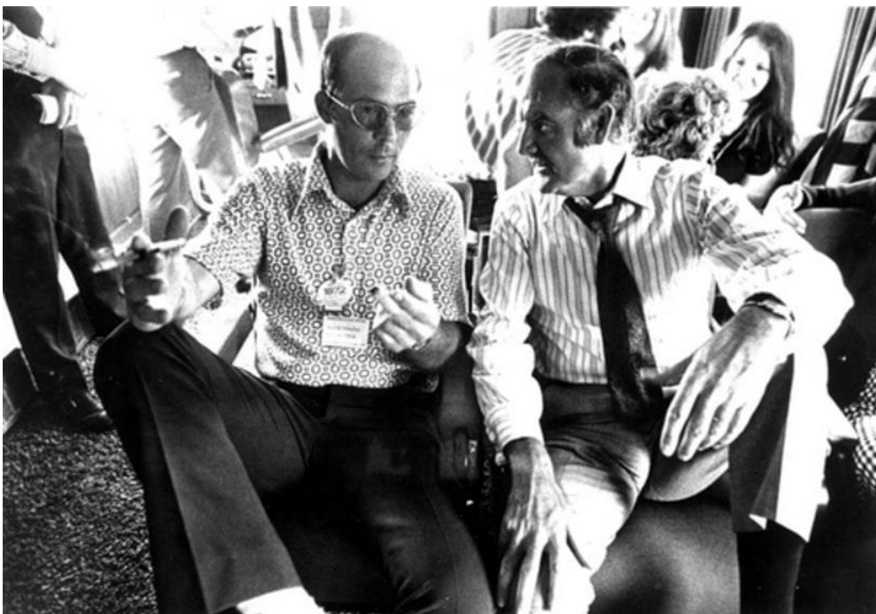
Hunter Thompson et McGovern au moment de la campagne présidentielle, en 1972.

Dès lors les journalistes gonzo s'arrogent le droit d'user d'une extrême subjectivité, dans un geste à forte connotations politiques ou esthétiques.