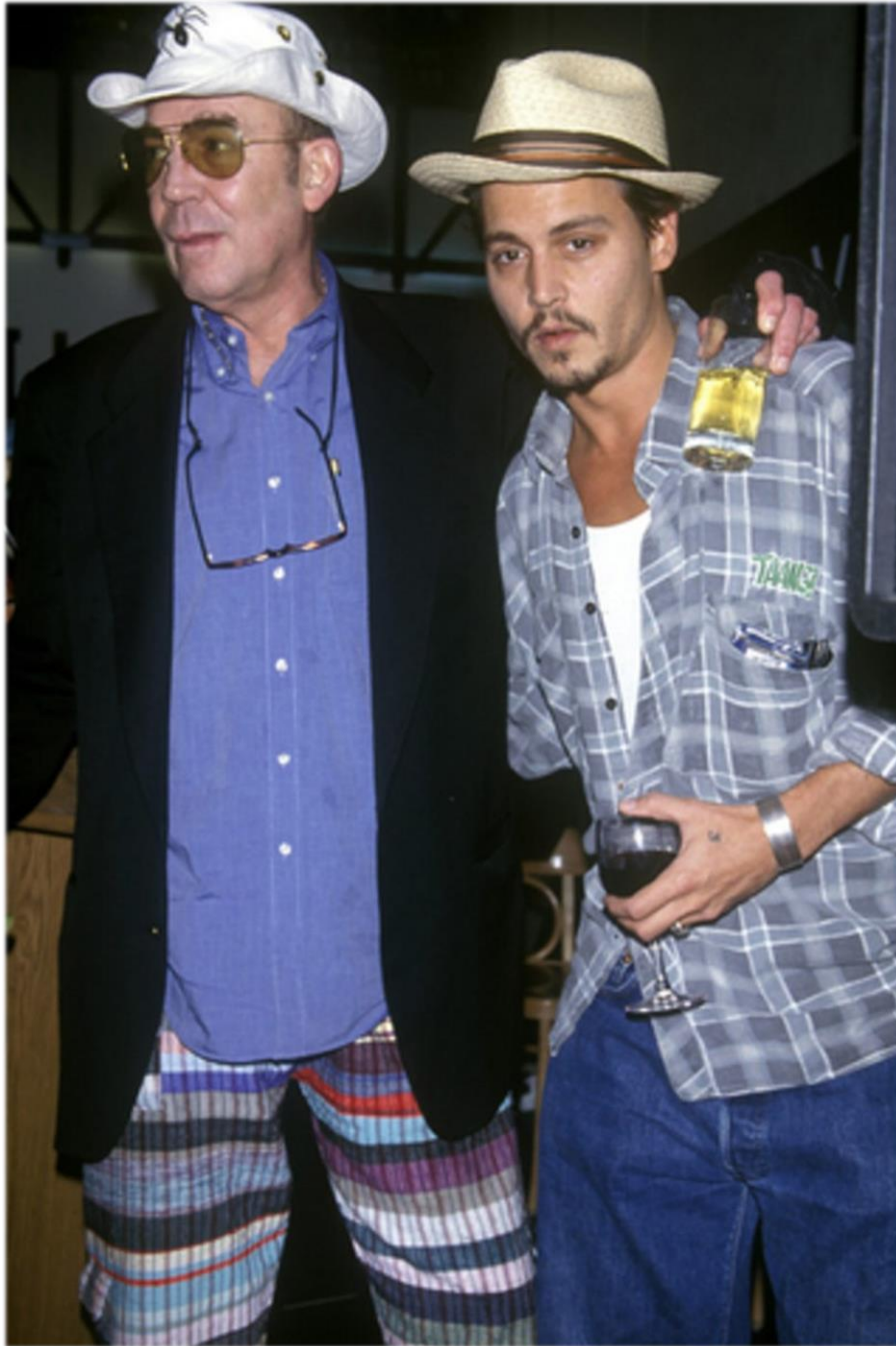
Hunter Thompson et Johnny Depp en 1998, au moment de la promo du film Las Vegas Parano.