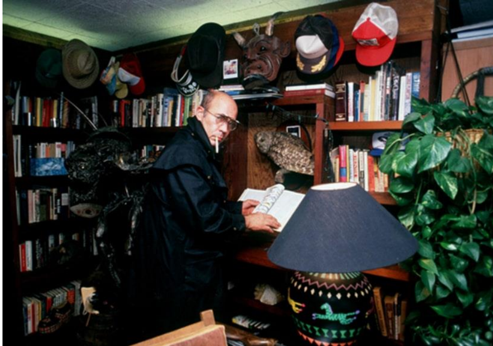
Hunter Thompson dans son bureau en 1990.

Dans le cas de Les Jours.fr , le public a offert un accueil chaleureux au développement d'un tel site d'information subjective, à travers le crowdfunding. Comme tout autre média actuellement, il doit néanmoins encore relever le défi de la durée, en pleine crise de la presse.