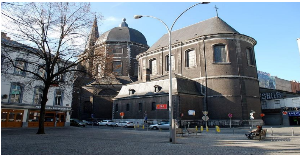
Figure 1 : Place Xavier-Neujean à Liège

Vers 11h30, les policiers, empruntant la rue Sébastien-Laruelle en direction de la place Xavier-Neujean, ont aperçu trois jeunes autour d'un des bancs. L'un d'eux était assis sur le dossier, les pieds disposés sur l'assise du banc. Cet espace étant public, les policiers ont pris l'initiative de s'approcher des jeunes afin de les prier d'utiliser en respect des autres citoyens le bien mis à disposition de la collectivité.