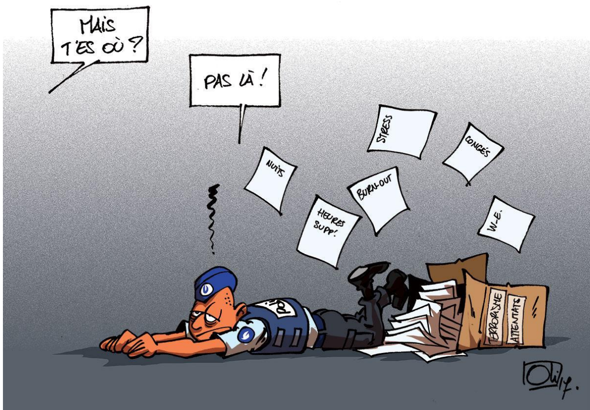
Oli – dessin du 15/09/2017 pour le groupe Sudpresse