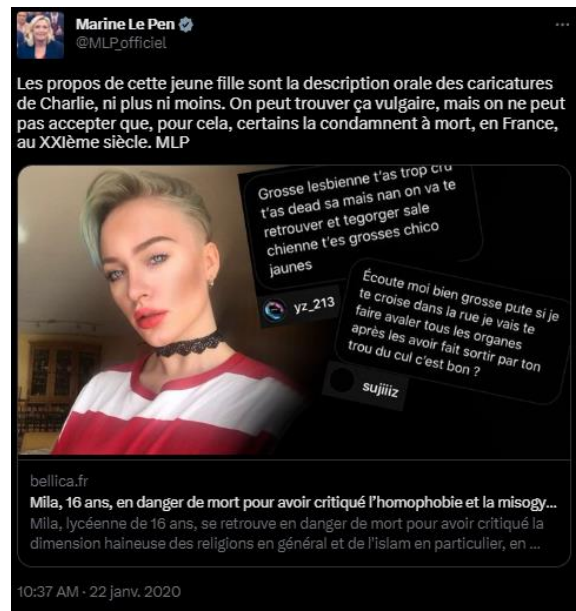
Tweet de Marine Le Pen - 22 janvier 2020

Le 22 janvier 2020, sur le réseau social Twitter, Marine Le Pen, femme politique française, adhérente au parti Rassemblement National, partage sur son compte Twitter le premier article consacré à Mila édité par le site Bellica, intitulé « Mila, 16 ans, en danger de mort pour avoir critiqué l'homophobie et la misogynie dans l'islam et « toutes les religions » » accompagné d'un commentaire personnel et du mot-dièse #JeSuisMila.