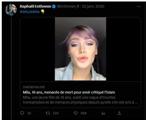
Tweet de Raphaël Enthoven - 22 janvier 2020

Le 22 janvier 2020, Raphaël Enthoven, philosophe français, publie cinq tweets consécutifs sur L’Affaire Mila. Dans ses tweets, il partage un article du quotidien « Marianne » consacré à l’affaire, des couvertures du journal Charlie Hebdo ainsi qu’une capture d’écran d’un message d’insultes envoyé à Mila.