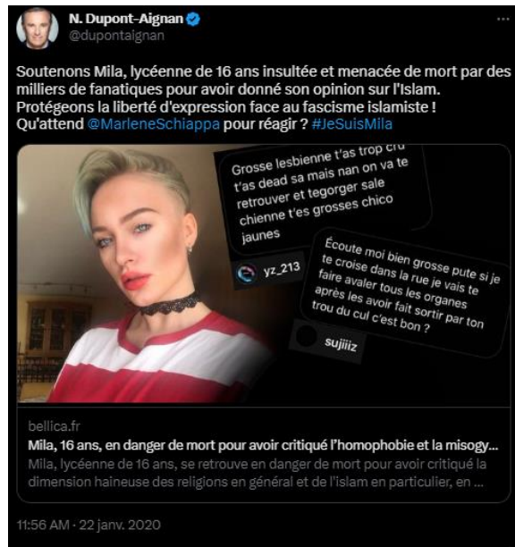
Tweet de Nicolas Dupont-Aignan- 22 janvier 2020