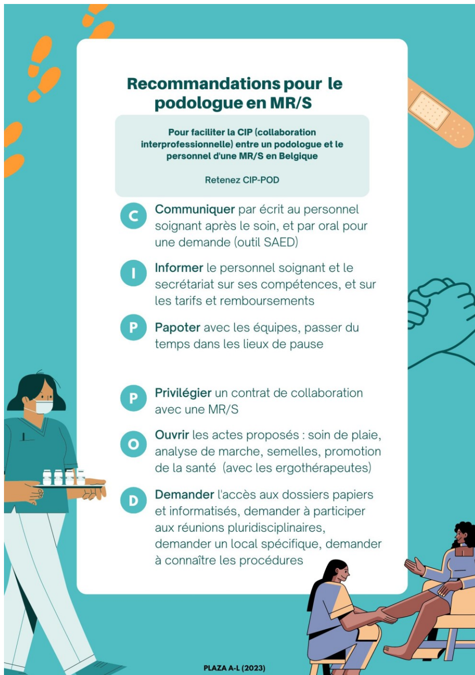
Figure 4 : Recommandations pour le podologue, pour faciliter la CIP avec le personnel d'une MR/S

L'outil de structuration de la communication orale entre professionnels de santé SAED (situation, antécédents, évaluation, demande) se situe en Annexe 3 de ce Mémoire.