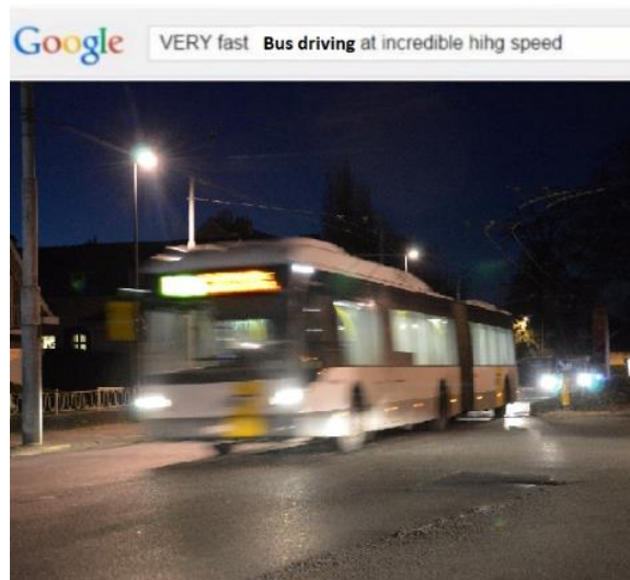
Figure 10: Shitpost 3

avis qui a été exprimé est considéré comme un troll (un message ayant pour but de parasiter une discussion ou énerver des gens en train d'avoir un débat). Le mot « bait » vient de l'anglais et signifie appât. En effet, il convient de dire que le but du troll auquel répond ce même est d'appâter les gens crédules ou susceptibles de s'enflammer dans une discussion. Ce même a été soumis à énormément de réadaptations, incluant celle-ci. Le principe de ce même est donc d'indiquer qu'un message est considéré comme un troll de qualité. C'est comme si la personne qui publiait cette image dans les commentaires reconnaissait que le troll était subtil, ou agréable à lire, tout en précisant que cela reste du parasitage de conversation. Il s'agit d'une façon de dire « bien joué » ou encore « tu m'as bien eu » à la personne ayant posté un avis visant à enflammer la discussion. Il peut également être utilisé au second pour énerver son interlocuteur en lui indiquant que ce qu'il dit n'a pas de sens, recouvrant ainsi un aspect plus parasitaire dans une discussion.