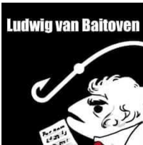
Figure 9: Shitpost 2

Le même se veut un jeu de mots entre le nom de famille de Maggie de Block et le fait que son visage soit dans un bloc. La description du même lorsqu'il a été posté dans le groupe Neurchi de Belgique indiquait justement ce jeu de mot « Maggie de blok » (le jeu de mots se voulait initialement en néerlandais, mais il fonctionne également en français). Le même ne correspond donc pas à une image macro en tant que tel, mais si on y ajoute la description qu'il avait lors de sa publication, cela revient pratiquement au même.