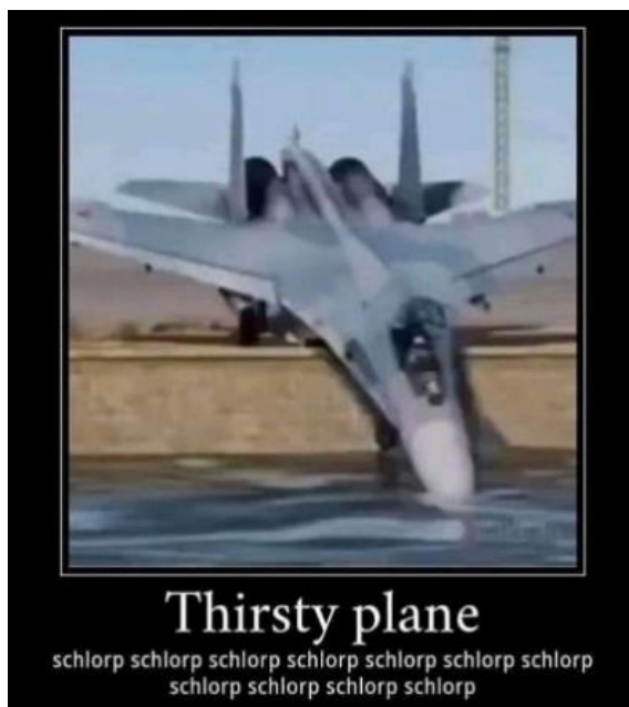
Figure 3: L'avion Shitpost

embrouiller des discussions, mais bien de partager du shitpost, du contenu de qualité jugée inférieure par rapport au contenu attendu sur le groupe Neurchi de Kaamelott).