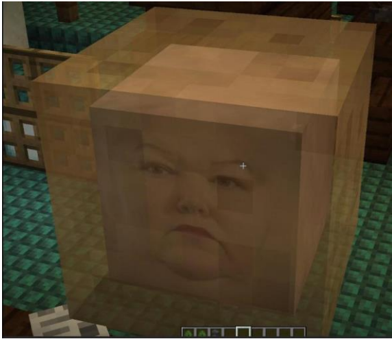
Figure 8: Shitpost 1

Le premier (fig. 8) représente un bloc (venant du jeu Minecraft) sur lequel a été intégré le visage de Maggie de Block, qui a recouvert plusieurs postes de ministre sous les gouvernements Michel et Wilmès. Le même ne contient pas de texte, c'est d'ailleurs le seul même présent dans ce mémoire qui