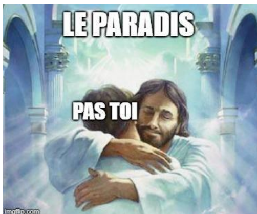
Figure 6: Normie 2

Le Mème Normie 2 (fig. 6) demande une interprétation particulière de l'image, il sera intéressant de voir comment les lecteurs interpréteront le message du mème. Le template qui a été utilisé dans le cadre de ce mème n'est pas un template habituel ou tiré d'un élément de la pop culture. Il s'agit simplement d'une image de Jésus prenant dans ses bras une personne rejoignant le paradis. Les mots « pas toi » sont écrits sur cette personne pour souligner qu'il ne s'agit