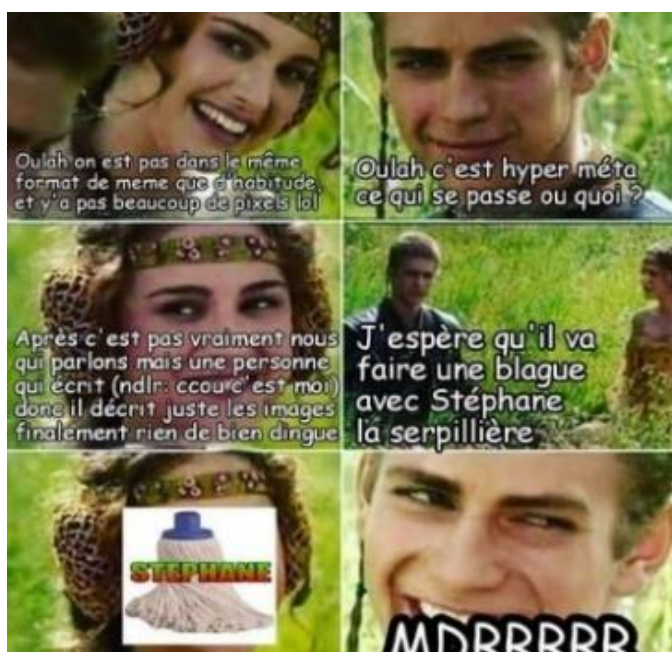
Figure 11: Meta 1

En ce qui concerne les meta- et antimèmes, une fois encore, un panel large au possible a été choisi afin de reprendre des mèmes avec les différentes caractéristiques de ces sous-genres.