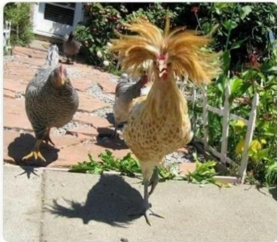
Figure 2: Le mème normie

- Gilberte, t'as encore picoré le fil électrique de la déco de Noël ! - Toi, ta gueule !