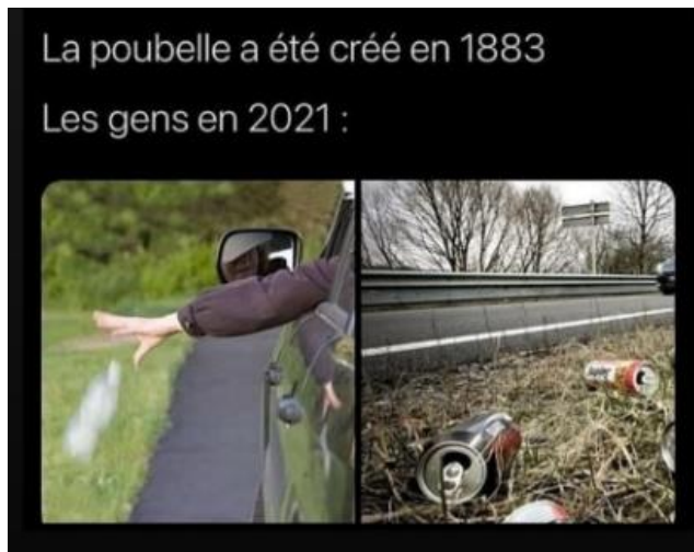
Figure 13: Meta 3

d'un faux exemple de ce que les gens faisaient avant l'invention ou la découverte de cette chose.