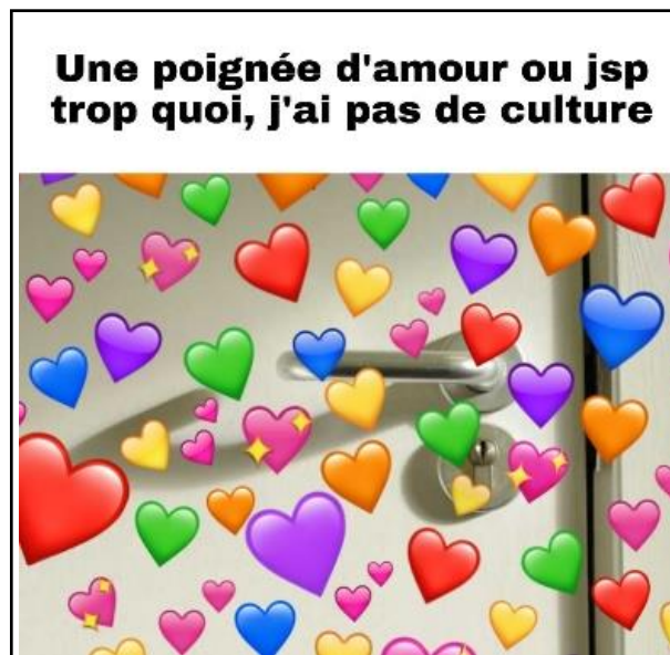
Figure 12: Meta 2

Concrètement il ne reste que les personnages tirés du premier film Star Wars et l'autoréférence du même au template de base qui nous font comprendre qu'il s'agit bien d'une réactualisation de ce même là. Il y a également une fausse référence à « Stéphane la serpillère », un faux même créé dans le cadre de ce metamême.