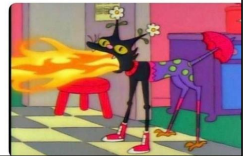
Figure 7: Normie 3

Quand des gens que tu connais de différents endroits se réunissent et tu dois garder la personnalité que tu as créée pour chacun d'entre eux en même temps