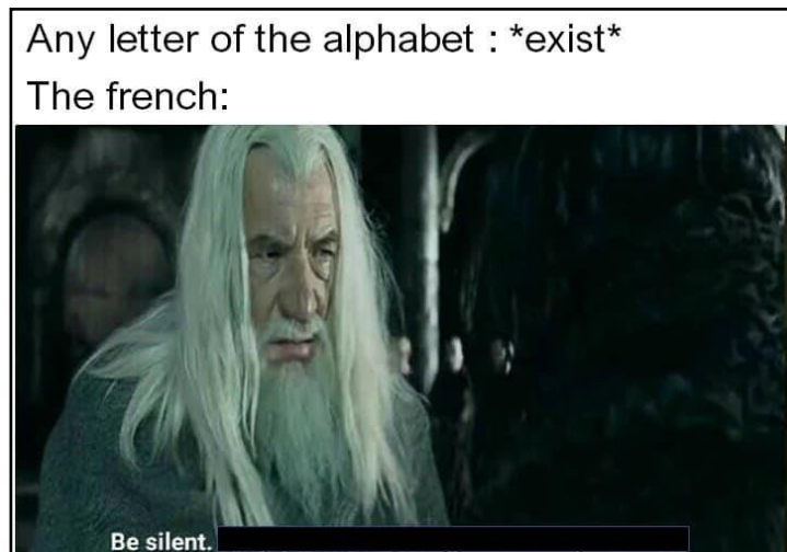
Figure 1: Exemple d'Image Macro

Dans cet exemple, on voit une image tirée d'un des films de la saga à succès « Le Seigneur des Anneaux ». Au-dessus de l'image se trouve le texte : « Any letter of the alphabet : *exist[s]* ; The french : ». De plus, une ligne de dialogue provenant du film faisait à l'origine partie de l'image, mais elle a été barrée dans sa quasi-entièreté, ne laissant que les mots « be silent ». Il s'agit d'une technique souvent utilisée dans le domaine des mèmes afin de détourner les propos de personnages, par exemple, ou afin de détourner les propos de mèmes déjà existants 7 .