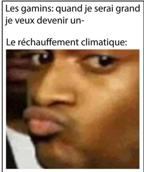
Figure 5: Normie 1

Le mème Normie 1 (fig. 5) fait appel à un template fréquent, appelé Conceited Reaction 10 , représentant le rappeur Conceited ayant une expression représentant une sorte de doute, de désaccord. Il sera intéressant de voir la réaction des personnes interviewées par rapport à cette image afin de voir si le fait de ne pas connaître le rappeur ou l'image en question aura un impact sur la perception du mème. Dans ce cas précis, le rappeur sert à représenter le réchauffement climatique, plutôt sceptique quant à la capacité des « gamins » d'avoir l'occasion de grandir et de devenir adultes. Ce mème véhicule donc également un message plus sérieux que le seul côté humoristique.