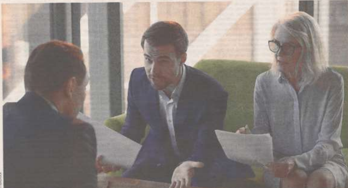
Selon certains notaires, le cas très médiatisé relatif à l’héritage de Johnny Hallyday a boosté les demandes pour les pactes en Belgique.