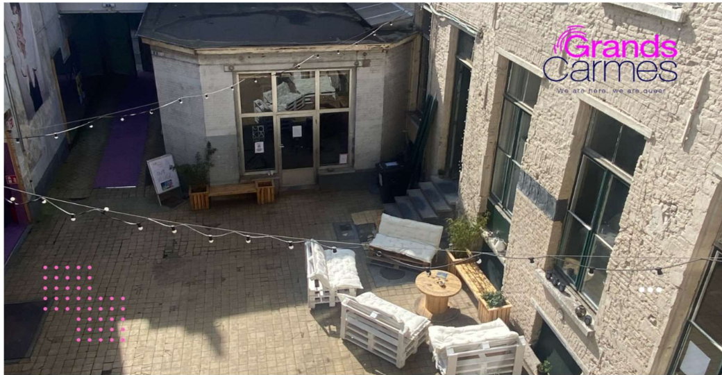
La cour des Grands Carmes. Capture d'écran issue de leur page Facebook, prise le 26 juillet 2023. En haut à droite : « Grands Carmes : We are here, we are queer »

Entrer aux Grands Carmes suppose de passer les grandes portes en bois vert foncé et de traverser un couloir extérieur avant de parvenir à la cour. Celle-ci donne accès à plusieurs bâtiments, dans les locaux desquels ont eu lieu les différentes parties de la formation. Bien qu'assez vétustes, ces locaux ont également un aspect artisanal et chaleureux qui leur confère un certain charme.