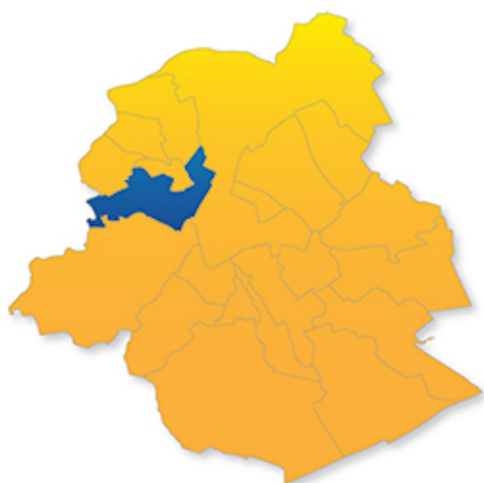
Figure 1 : Place de la commune dans Bruxelles 64