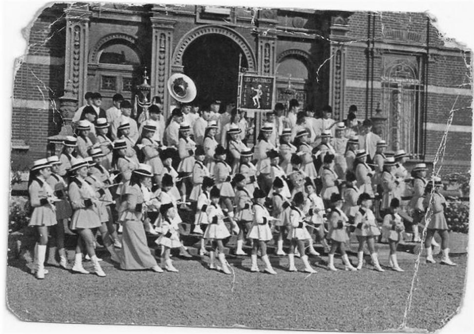
Photo : les Amazones de Gilly en 1970

à cause des coûts importants qu'elles engendrent et des rentrées d'argent de plus en plus faibles pour l'Union des Commerçants. Pour les éditions de 2017, les braderies ont été amputées du groupe folklorique « les Amazones de Gilly ». Ces femmes animaient les braderies depuis plus de quarante années consécutives.