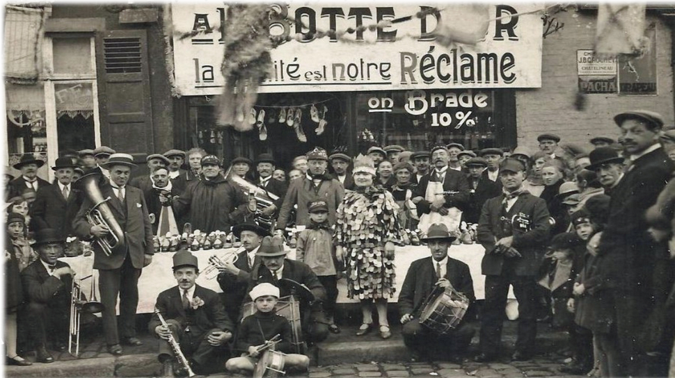
Photo : inauguration de la braderie de 1928 « À la botte d'or », boutique spécialisée dans les chaussures

membres organisent également des activités devant leur échoppe : un ténor, un jazz-band, un prestidigitateur ou encore des clowns prennent part à la fête. La braderie est un véritable triomphe. 10