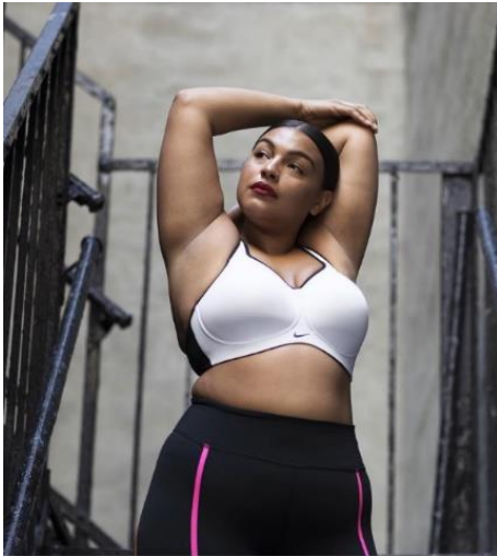
Paloma Elsesser, mannequin.