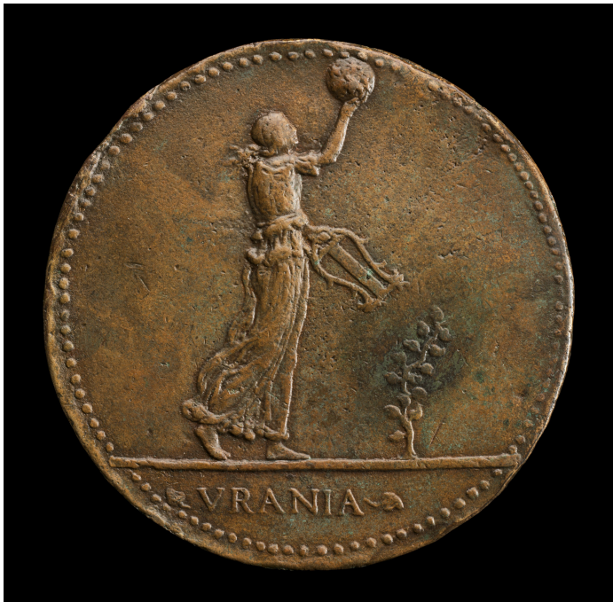
Adriano Fiorentino, Urania Holding a Globe and Lyre [revers], National Gallery of Art, Washington