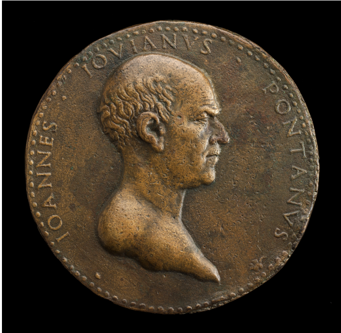
Adriano Fiorentino, Giovanni Gioviano Pontano, 1426-1503, Poet [avers], National Gallery of Art, Washington