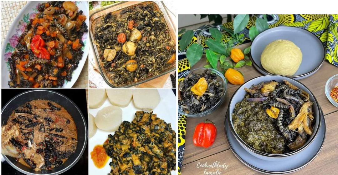
mbinzo mwamba nguba na kwanga