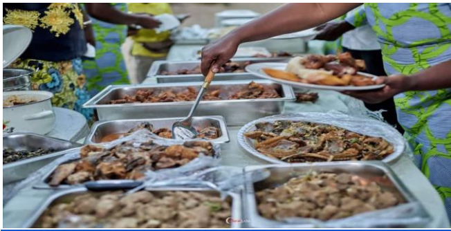
likayabu, soso, Mpiodi na taba