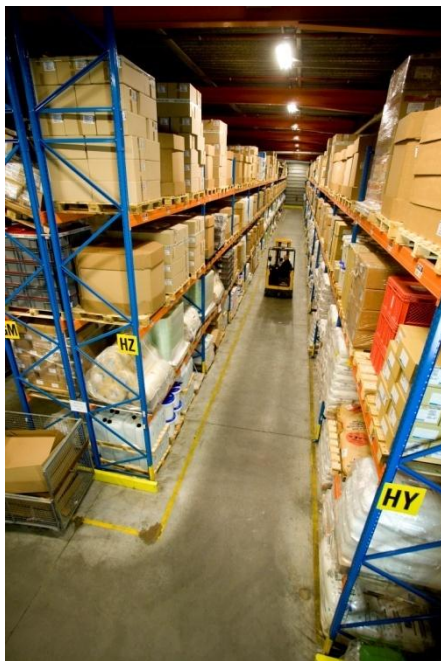
Figure 2: Entrepôt des matières premières