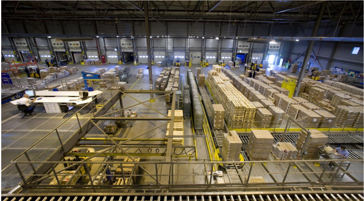
Figure 1: BDCE-Quais de chargement et déchargement