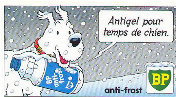
Publicité Antigel BP

La litote est « un procédé qui consiste à dire moins pour faire entendre plus. Le sens implicite est donc plus fort que le sens explicite si bien si bien que l'expression affaiblie sert à renforcer la pensée. On