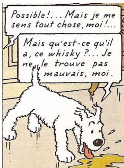
Tintin et les Picaros, p. 3

poétique de M. Aquien 28 est tout autre : « On appelle personnification le fait de donner, par une image, à des êtres non humains ou non animés, ou même à des abstractions, des sentiments et des comportements humains... ». Dans cette deuxième définition, il est convenu que les animaux peuvent se voir attribuer des traits humains. Or, dans la première définition il semblerait que cela ne soit pas le cas.