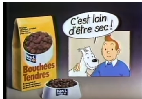
Publicité Bouchées Tendres de Ken-L Ration

Tout comme dans la bande dessinée, le calembour est également présent dans les publicités mettant en scène des personnages du monde d'Hergé. Dans l'affiche publicitaire pour un antigel (Milou n°1), nous voyons Milou prendre la parole : « Antigél pour temps de chien ». Milou étant un chien, il s'agit donc bien là d'un jeu de mot.