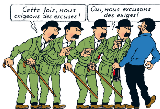
On a marché sur la Lune, p. 56

La contrepèterie est une « intervention des lettres ou des syllabes d'un ensemble de mots spécialement choisis afin d'en obtenir d'autres dont l'assemblage ait également un sens, de préférence burlesque ou grivois 17 ».