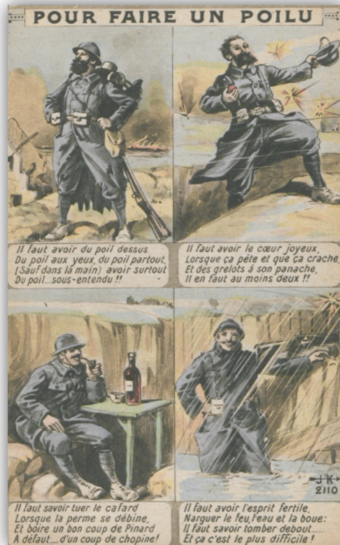
Fig. 3. Pour faire un poilu , anonyme, J. K., n°2110.