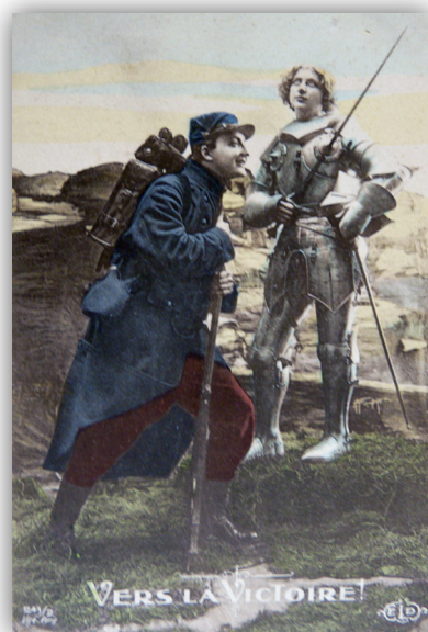
Fig. 4. Vers la Victoire, anonyme, E. L. D.