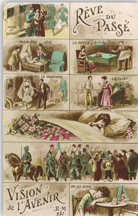
Fig. 2. Rêve du passé, vision de l'avenir, anonyme, E. M., n°237.