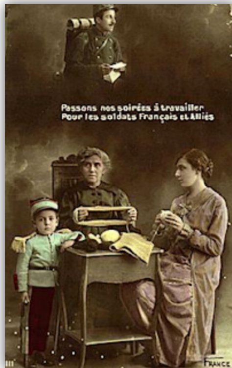
Fig. 5. Passons nos soirées à travailler... , anonyme, France.

Premièrement, comme le montre la figure 5, les épouses et parfois aussi les mères sont représentées alors qu'elles participent à l'effort de guerre travaillant à leur ouvrage habituel et guettant le retour de leur époux ou de leur fils 37 . En effet, en l'absence du chef de famille, les épouses apparaissent comme les gardiennes du foyer et sont érigées en repère moral 38 . À l'inverse, il existe très peu de représentations de jeunes femmes récemment employées dans les industries. De même, les agricultrices qui remplacent leur mari mobilisé en travaillant au champ sont rares dans les illustrations.