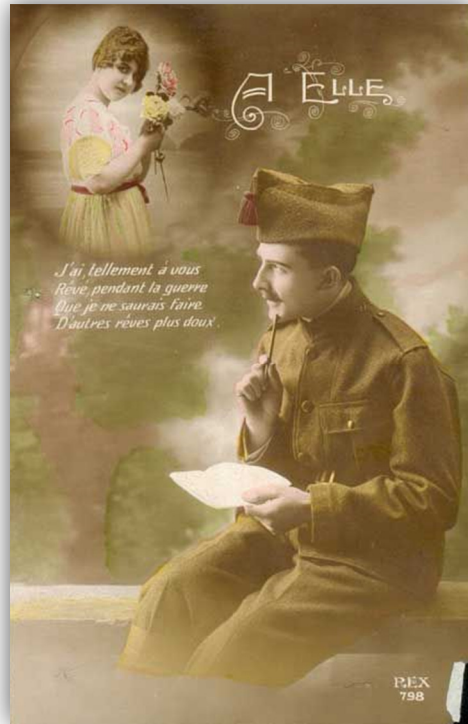
Fig. 1. À Elle, anonyme, P. EX., n°798.