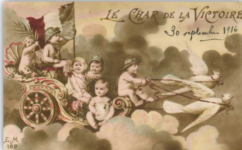
Fig. 8. Le char de la Victoire , anonyme, E. M., n°169.

Enfin, la représentation de l'enfant rappelle aux soldats qu'ils se battent pour leur famille et symbolise la conviction du retour au foyer. Lorsque l'iconographie recourt à la représentation du bébé, ce dernier symbolise la survie des valeurs françaises et le prolongement du père, surtout en cas de décès.